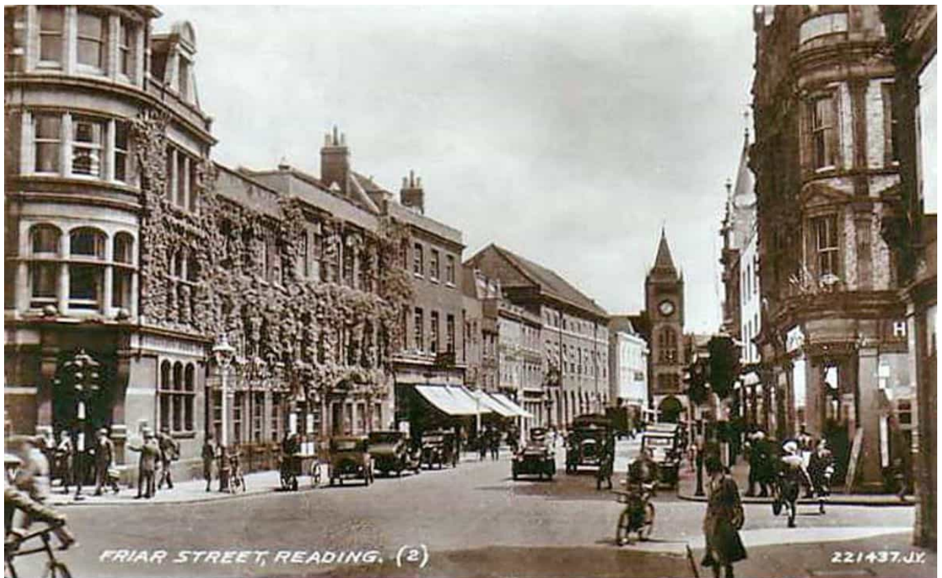
Die Friar Street in Reading auf einer Postkarte von 1945