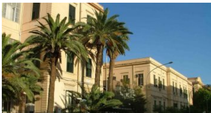
Die Universität in Palermo

Einen Namen hat sich Leoluca Orlando seit dem erste Amtsantritt als Bürgermeister von Palermo im Jahr 1985 als „Mafiajäger“ gemacht. Wobei seine tatsächliche Rolle innerhalb der verschiedenen Polizisten, Juristen und Publizisten, die gegen das organisierte Verbrechen auf Sizilien aktiv waren und sind, umstritten ist. Ob es in irgendeiner Weise sein Verdienst ist, dass die Stadt heute nicht mehr von der Mafia beherrscht wird, ist nicht belegbar. Er selbst hält sich in dieser Sache mit Eigenlob sehr zurück.