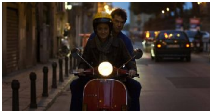
Campino im Wim-Wenders-Film „Palermo Shooting“

Von Blinky Palermo bis zu Palermo Shooting