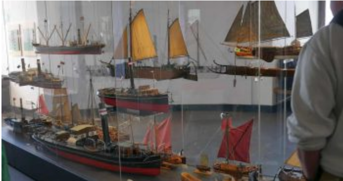
Vitrine mit Modellen im Schifffahrtsmuseum

Bekanntlich liegt Düsseldorf am Rhein, und der mächtige Strom ist seit alters her eine der bedeutendsten Wasserstraßen Europa. Gut, dass es in unserer Stadt ein kleines, aber sehr feines Schifffahrtsmuseum gibt. Das ist im Schlossturm am Burgplatz untergebracht und seit 2015 nach ausgiebigen Renovierungsarbeiten wieder geöffnet. Es handelt sich in erster Linie um eine didaktische Dauerausstellung zur Rheinschifffahrt, die regelmäßig durch hochinteressante Vorträge und Führungen ergänzt wird. Besonders Kinder lieben den Turm und die vielen Modelle auf den fünf Etagen. Und wenn man sich dann gemütlich alles angesehen hat, kann man oben in der sogenannten Laterne einkehren, sich erfrischen und die tollen Blicke über das Rheinufer und die Altstadt genießen.