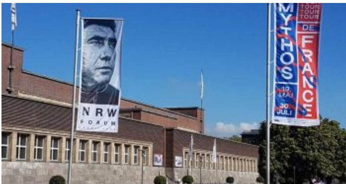
Das NRW Forum im Ehrenhof - mehr Pop als alles andere

Wer seine Kindheit und Jugend im Düsseldorf der Sechzigerjahre verbracht hat, erinnert sich wehmütig an das sogenannte „Wirtschaftsmuseum“, das in Wahrheit „Landesmuseum Volk und Wirtschaft“ hieß. In allen Ferien musste man einmal dorthin, auch wenn man die vielen Exponate, vor allem die interaktiven Dinge und den nachgebauten Bergwerksstollen im Keller in- und