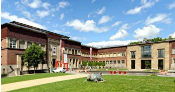
Der Kunstpalast im Ehrenhof mit dem West- und Ostflügel

Das ehemalige Kunstmuseum Düsseldorf nimmt den größten Teil des Ehrenhofs ein, dessen Westflügel zum Teil aus umgebauten Elementen des an dieser Stelle im 19. Jahrhundert erbauten Kunstpalastes besteht. Bekanntlich wurde das ganze Ensemble aus Rheinterrasse, Rheinhalle (heute: Tonhalle) und Ehrenhof zur berühmten Ausstellung Gesolei im Jahr 1926 errichtet. Bis 2001 betrieb die Stadt diesen Museumskomplex mit der Sammlung im Westflügel und speziell für Ausstellungen Düsseldorfischer Künstler genutzten Ostflügel – bekannt vor allem durch die sogenannte „ Große Kunstausstellung „. Besonders dieser Teil war einigermaßen marode und nur teilweise nutzbar; so entschloss sich die Stadt zu einer Privat-Public-Partnership mit der E.ON und der Metro-Group, die Mittel für den grundlegenden Umbau erbrachte. Im Gegenzug durfte die E.ON ein städtisches Grundstück in unmittelbarer Nachbarschaft des Museums, das eigentlich nicht als Bauland vorgesehen war, für einen Neubau nutzen.