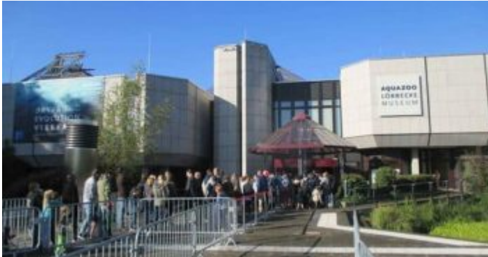
Der Aquazoo mit dem Löbbecke-Museum im Nordpark

Bis Mitte der Achtzigerjahre konnte man die naturkundliche Sammlung des Düsseldorfer Apothekers Theodor Löbbecke in einem Hochbunker gegenüber des Zooparks sehen – weil es zudem eine Abteilung mit Hunderten von Aquarien und Terrarien gab, ist der ganze Bunker im Volksmund einfach nur „Aquarium“. Das Grundstück war begehrt, der Bunker sollte weg, und so kam es 1987 zum Umzug in den Neubau im östlichen Bereich des Nordparks und die Umbenennung in „Aquazoo“. Das Löbbecke-Museum war mit umgezogen, wurde aber am neuen Ort ein bisschen stiefmütterlich behandelt. Das änderte sich nach der Sanierung samt Umbau zwischen 2014 und 2017. Immer noch stehen die vielen Gehege für alles, was im und um das Wasser herum kreucht und fleucht bei den Besuchern im Vordergrund. Das neue Konzept aber hat viele der gesammelten Exponate des Löbbecke-Museums aufs Feinste integriert. Der Andrang an Wochenenden, an Feiertagen und in den Ferien ist oft so groß, dass man sich online Tickets besorgen sollte, um langes Anstehen an den Kassen zu vermeiden oder Gefahr zu laufen gar nicht eingelassen zu werden.