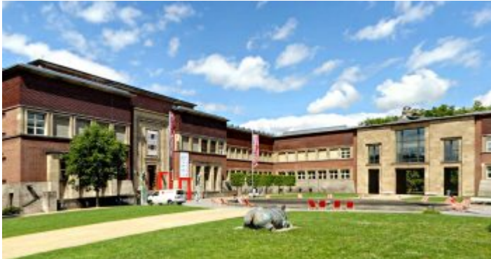
Der Kunstpalast im Ehrenhof mit dem West- und Ostflügel

Das ehemalige Kunstmuseum Düsseldorf nimmt den größten Teil des Ehrenhofs ein, dessen Westflügel zum Teil aus umgebauten Elementen des an dieser Stelle im 19. Jahrhundert erbauten Kunstpalastes besteht. Bekanntlich wurde das ganze Ensemble aus Rheinterrasse, Rheinhalle (heute: Tonhalle) und Ehrenhof zur berühmten Ausstellung Gesolei im Jahr 1926 errichtet. Bis 2001 betrieb die Stadt diesen Museumskomplex mit der Sammlung im Westflügel und speziell für Ausstellungen Düsseldorfischer Künstler genutzten Ostflügel – bekannt vor allem durch die sogenannte „ Große Kunstausstellung „. Besonders dieser Teil war einigermaßen marode und nur teilweise nutzbar; so entschloss sich die Stadt zu einer Privat-Public-Partnership mit der E.ON und der Metro-Group, die Mittel für den grundlegenden Umbau erbrachte. Im Gegenzug durfte die E.ON ein städtisches Grundstück in unmittelbarer Nachbarschaft des Museums, das eigentlich nicht als Bauland vorgesehen war, für einen Neubau nutzen.