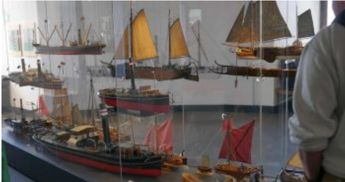
Vitrine mit Modellen im Schifffahrtsmuseum

Bekanntlich liegt Düsseldorf am Rhein, und der mächtige Strom ist seit alters her eine der bedeutendsten Wasserstraßen Europa. Gut, dass es in unserer Stadt ein kleines, aber sehr feines Schifffahrtsmuseum gibt. Das ist im Schlossturm am Burgplatz untergebracht und seit 2015 nach ausgiebigen Renovierungsarbeiten wieder geöffnet. Es handelt sich in erster Linie um eine didaktische Dauerausstellung zur Rheinschifffahrt, die regelmäßig durch hochinteressante Vorträge und Führungen ergänzt wird. Besonders Kinder lieben den Turm und die vielen Modelle auf den fünf Etagen. Und wenn man sich dann gemütlich alles angesehen hat, kann man oben in der sogenannten Laterne einkehren, sich erfrischen und die tollen Blicke über das Rheinufer und die Altstadt genießen.