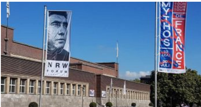
Das NRW Forum im Ehrenhof - mehr Pop als alles andere

Wer seine Kindheit und Jugend im Düsseldorf der Sechzigerjahre verbracht hat, erinnert sich wehmütig an das sogenannte „Wirtschaftsmuseum“, das in Wahrheit „Landesmuseum Volk und Wirtschaft“ hieß. In allen Ferien musste man einmal dorthin, auch wenn man die vielen Exponate, vor allem die interaktiven Dinge und den nachgebauten Bergwerksstollen im Keller in- und