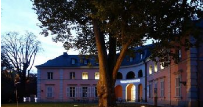
Das Theatermuseum öffnet sich zum Hofgarten