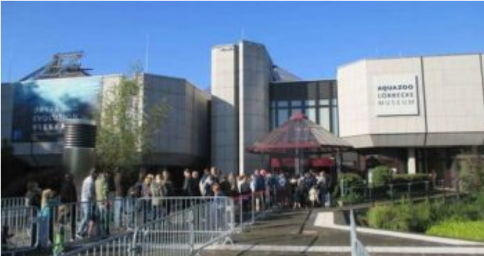
Der Aquazoo mit dem Löbbeke-Museum im Nordpark

Bis Mitte der Achtzigerjahre konnte man die naturkundliche Sammlung des Düsseldorfer Apothekers Theodor Löbbeke in einem Hochbunker gegenüber des Zooparks sehen – weil es zudem eine Abteilung mit Hunderten von Aquarien und Terrarien gab, ist der ganze Bunker im Volksmund einfach nur „Aquarium“. Das Grundstück war begehrt, der Bunker sollte weg, und so kam es 1987 zum Umzug in den Neubau im östlichen Bereich des Nordparks und die Umbenennung in „Aquazoo“. Das Löbbeke-Museum war mit umgezogen, wurde aber am neuen Ort ein bisschen stiefmütterlich behandelt. Das änderte sich nach der Sanierung samt Umbau zwischen 2014 und 2017. Immer noch stehen die vielen Gehege für alles, was im und um das Wasser herum kreucht und fleucht bei den Besuchern im Vordergrund. Das neue Konzept aber hat viele der gesammelten Exponate des Löbbeke-Museums aufs Feinste integriert. Der Andrang an Wochenenden, an Feiertagen und in den Ferien ist oft so groß, dass man sich online Tickets besorgen sollte, um langes Anstehen an den Kassen zu vermeiden oder Gefahr zu laufen gar nicht eingelassen zu werden.