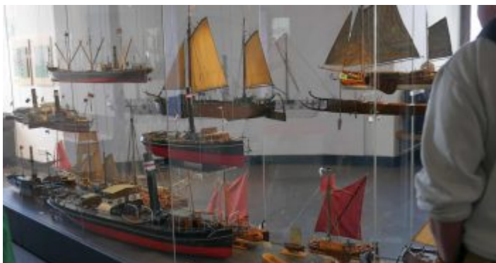
Vitrine mit Modellen im Schifffahrtsmuseum

Bekanntlich liegt Düsseldorf am Rhein, und der mächtige Strom ist seit alters her eine der bedeutendsten Wasserstraßen Europa. Gut, dass es in unserer Stadt ein kleines, aber sehr feines Schifffahrtsmuseum gibt. Das ist im Schlossturm am Burgplatz untergebracht und seit 2015 nach ausgiebigen Renovierungsarbeiten wieder geöffnet. Es handelt sich in erster Linie um eine didaktische Dauerausstellung zur Rheinschifffahrt, die regelmäßig durch hochinteressante Vorträge und Führungen ergänzt wird. Besonders Kinder lieben den Turm und die vielen Modelle auf den fünf Etagen. Und wenn man sich dann gemütlich alles angesehen hat, kann man oben in der sogenannten Laterne einkehren, sich erfrischen und die tollen Blicke über das Rheinufer und die Altstadt genießen.