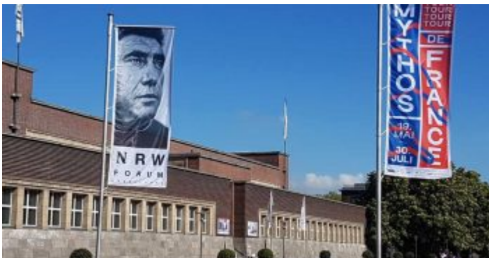
Das NRW Forum im Ehrenhof - mehr Pop als alles andere

Wer seine Kindheit und Jugend im Düsseldorf der Sechzigerjahre verbracht hat, erinnert sich wehmütig an das sogenannte „Wirtschaftsmuseum“, das in Wahrheit „Landesmuseum Volk und Wirtschaft“ hieß. In allen Ferien musste man einmal dorthin, auch wenn man die vielen Exponate, vor allem die interaktiven Dinge und den nachgebauten Bergwerksstollen im Keller in- und