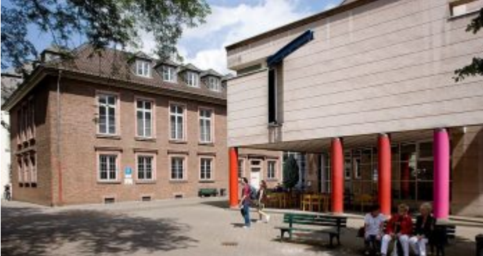
Das Stadtmuseum am Rande der Altstadt