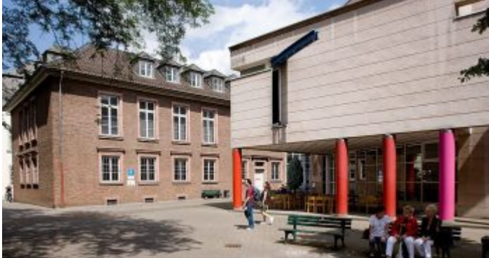
Das Stadtmuseum am Rande der Altstadt