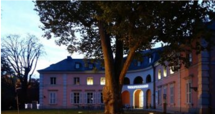
Das Theatermuseum öffnet sich zum Hofgarten