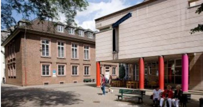
Das Stadtmuseum am Rande der Altstadt

Erst seit 1991 hat das Stadtmuseum seinen festen Platz am Rande der Altstadt gefunden. 1974 ursprünglich als historisches Museum vorgesehen, veränderte und entwickelte sich das Haus über die Jahrzehnte ständig und zog dabei etliche Male um. Das Konzept bezeichnet das Team um Direktorin Dr. Susanne Anna als stadtgeschichtlich, stadttheoretisch und partizipativ. Im Klartext: Im Erweiterungsbau des Spee'schen Palais zwischen Berger Allee und Bäckerstraße finden sich nicht nur jede Menge historischer Exponate, sondern auch Material rund um urbanes Bauen, Planen und Leben – dazu ein wechselndes und spannendes Programm zum Mitmachen. Wer das Stadtmuseum kennenlernen will, ist gut beraten, zuerst einen schnellen Rundgang zu wagen, um sich mit dem Angebot vertraut zu machen. Bei Bedarf kann man sich dann über einzelne Themen weiter informieren. Übrigens: Stadtmuseum und Stadtarchiv sind in Düsseldorf zwei voneinander getrennte Institutionen.