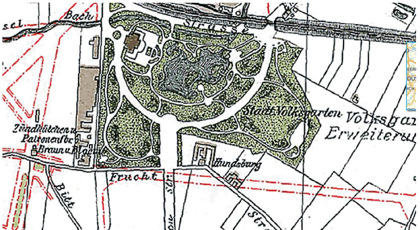
Die Lage auf einer Karte von 1906 (via maps.duesseldorf.de )

Bei der Hundsburg beziehungsweise dem Hundsdorf handelte es sich um ein im 17. Jahrhundert erbautes, kleines Jagdschloss in einem kleinen Weiler mit drei oder vier kleineren Höfen. Die Lage ist auf einem Stadtplan von 1906 gut zu erkennen. Bei den gezeigten Gebäuden handelt es sich aber schon nicht mehr um den ursprünglichen Weiler. Denn aus der ursprünglichen Anlage war im Laufe der Jahre ein Anwesen geworden – etwa so wie die anderen Herrenhäuser im Düsseldorfer Umland. Weil hier von Alters her der Hundertschaftsrichter als Gemeindeverwalter residierte, gab es auch eine Richtstätte und das Haus des Scharfrichters.