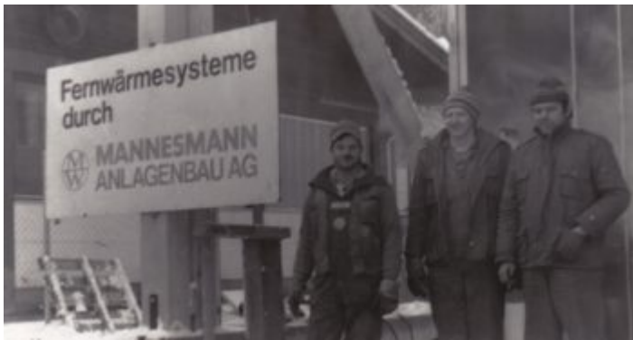
In Österreich gibt es sie noch, die Mannesmann Anlagenbau AG

gingen Arbeitsplätze in nennenswertem Umfang verloren – weder bei der gekauften Firma, noch bei Mannesmann.