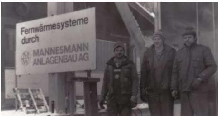
In Österreich gibt es sie noch, die Mannesmann Anlagenbau AG

gingen Arbeitsplätze in nennenswertem Umfang verloren – weder bei der gekauften Firma, noch bei Mannesmann.