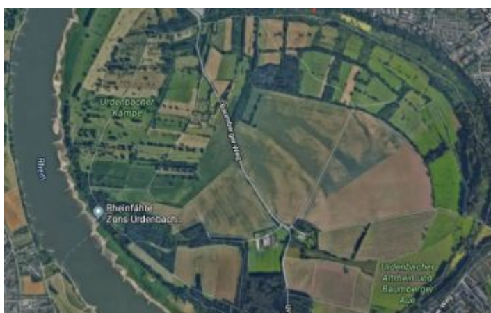
Google-Map: Der Altrhein bei Düsseldorf-Urdenbach

[Die erste Hitzewelle im Jahr ist da. Wer jetzt an den Rhein geht, sucht die frische Brise. Aber besser ist es, wenn man am Fluss auch Schatten findet. Wir haben ein paar schattige Stellen ausgesucht.] Man kann sich darüber streiten, ob das Gebiet im Süden Düsseldorfs, das „Urdenbacher Altrhein“ heißt, überhaupt ein Wald ist. Tatsächlich handelt es sich um das Gebiet längst des Bachs, der erst „Garather Mühlenbach“ genannt wird, um den Prototyp des Auenwaldes, der für Düsseldorf typisch ist. Und es ist das Verdienst hartnäckiger Ökologen, dass die Region nach und nach dereguliert, renaturiert und dynamisiert wurde – zuletzt vor Kurzem, als man zwei Deichdurchbrüche anlegte und damit das Überflutungsgebiet wieder voll funktionsfähig machte. Denn es ist das Land zwischen Baumberg, Garath und Urdenbach, das dafür sorgt, dass Düsseldorf bei Hochwasser nicht zu Schaden kommt. Abgesehen davon haben die Maßnahmen für eine einzigartige Vielfalt in diesem wunderschönen Naturschutzgebiet gesorgt.