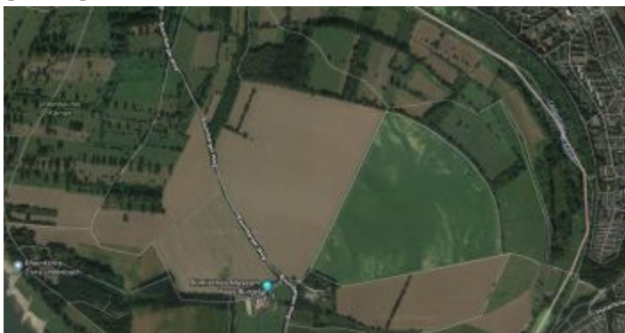
Google-Map: Urdenbacher Altrhein

Man kann sich darüber streiten, ob das Gebiet im Süden der Stadt, das „Urdenbacher Altrhein“ heißt, überhaupt ein Wald ist. Tatsächlich handelt es sich längst des Bachs, der erst „Garather Mühlenbach“ genannt wird, um den Prototyp des Auenwaldes, der für Düsseldorf typisch ist. Und es ist das Verdienst hartnäckiger Ökologen, dass die Region nach und nach dereguliert, renaturiert und dynamisiert wurde – zuletzt vor Kurzem, als man zwei Deichdurchbrüche anlegte und damit das Überflutungsgebiet wieder voll funktionsfähig machte. Denn es ist das Land zwischen Baumberg, Garath und Urdenbach, das dafür sorgt, dass Düsseldorf bei Hochwasser nicht zu Schaden kommt. Abgesehen davon haben die Maßnahmen für eine einzigartige Vielfalt in diesem wunderschönen Naturschutzgebiet gesorgt.