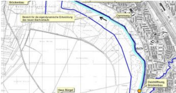
Das Projekt „Deichöffnung“

erreichen, darf man nicht gleich links am Parkplatz einbiegen – dieser Weg führt zwar auch durch den Wald, ist aber nicht der attraktive Pfad. Der beginnt als Verlängerung des Stümper Wegs, der gleich hinter der Straßenüberführung über den Altrhein anfängt. Der ist wiederum die optische Verlängerung des Ortswegs, der runter zur Rheinfähre Zons-Urdenbach geht.