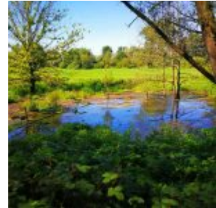
Sumpfland am Urdenbacher Altrhein

Man kann sich darüber streiten, ob das Gebiet im Süden der Stadt, das „Urdenbacher Altrhein“ heißt, überhaupt ein Wald ist. Tatsächlich handelt es sich längst des Bachs, der erst „Garather Mühlenbach“ genannt wird, um den Prototyp des Auenwaldes, der für Düsseldorf typisch ist. Und es ist das Verdienst hartnäckiger Ökologen, dass die Region nach und nach dereguliert, renaturiert und dynamisiert wurde – zuletzt vor Kurzem, als man zwei Deichdurchbrüche anlegte und damit das Überflutungsgebiet wieder voll funktionsfähig machte. Denn es ist das Land zwischen Baumberg, Garath und Urdenbach, das dafür sorgt, dass Düsseldorf bei Hochwasser nicht zu Schaden kommt. Abgesehen davon haben die Maßnahmen für eine einzigartige Vielfalt in diesem wunderschönen Naturschutzgebiet gesorgt.