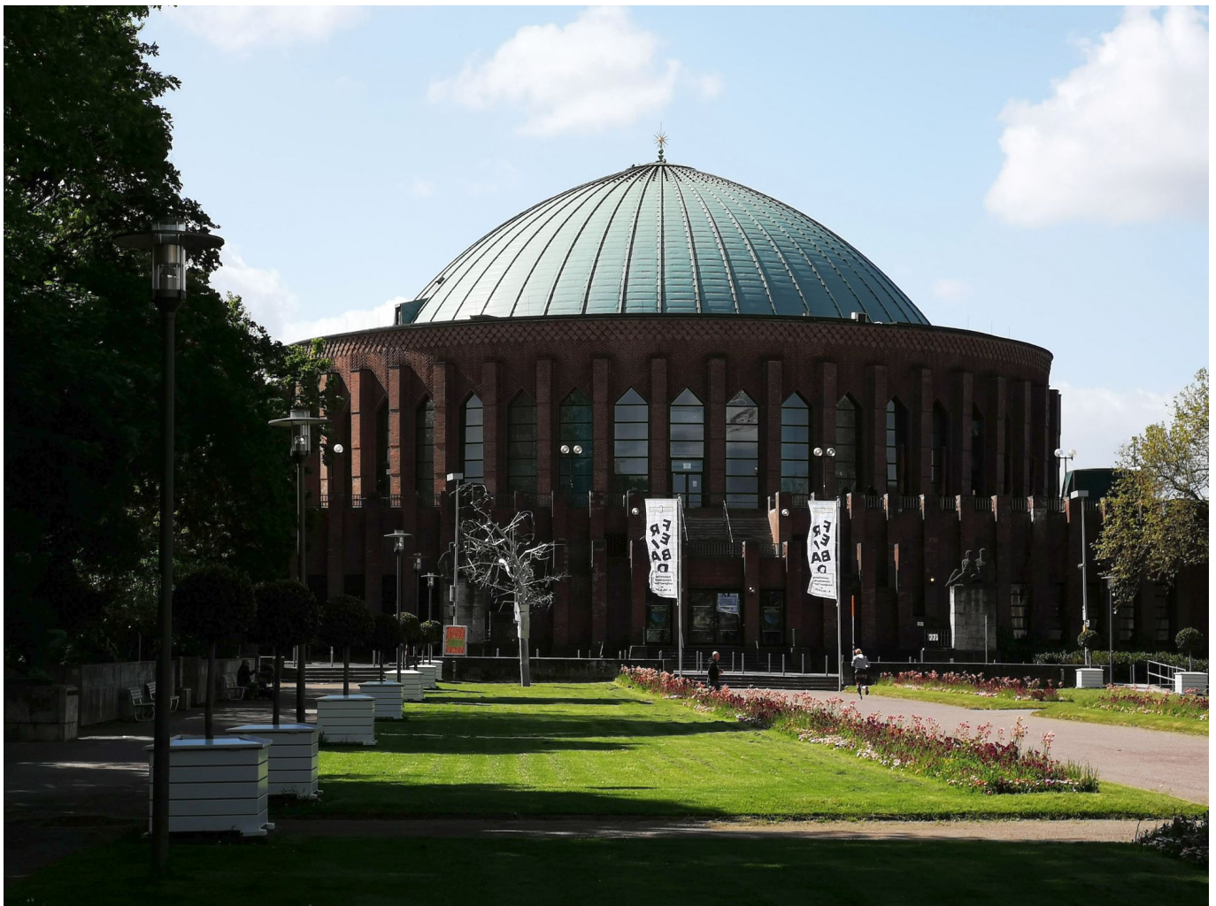
Die Tonhalle vom Ehrenhof aus gesehen

In den Räumen der Tonhalle feierte auch das närrische Brauchtum seine Feste, zum Beispiel den legendären, von Professoren und Studenten der Kunstakademie initiierten Maskenball nach venezianischem Vorbild, der nicht nur den typisch düsseldorferischen Saalkarneval begründete, sondern dafür sorgte, dass die Düsseldorfer Karnevalsprinzessin immer „Venezia“ heißt. Der Kaisersaal war den großen Konzerten mit Orchestern vorbehalten, im Rittersaal fand auch die leichtere Unterhaltung Platz, und im Garten gab es im Sommer regelmäßig Tanzveranstaltungen.