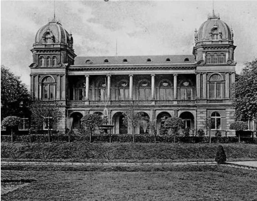
So prächtig war das Konzertgebäude im Floragarten, das 1912 abgerissen wurde

Regelmäßig spielte dort die Kapelle des in Düsseldorf stationierten Infanterieregiments. Es gab Aufführungen von Singspielen und Operetten und überhaupt vorwiegend Darbietungen der leichten Muse. Warum die Stadt 1902 die Aktien der Gesellschaft übernahm, ist unklar. Jedenfalls wurde der aufwändig angelegte Park zur öffentlichen Anlage; der Musikpavillon wurde abgerissen und das Palmenhaus in den Zoo in Düsseldorf verlegt. Die Tonhalle diente noch bis zum Beginn des ersten Weltkriegs als Veranstaltungsort. Dann wurde sie zum Lazarett, später zu einem Steueramt und einer Verwaltungsakademie. Im zweiten Weltkrieg wurde das Gebäude so stark beschädigt, dass es abgerissen werden musste. An seiner Stelle steht heute das Haus der Wissenschaft.