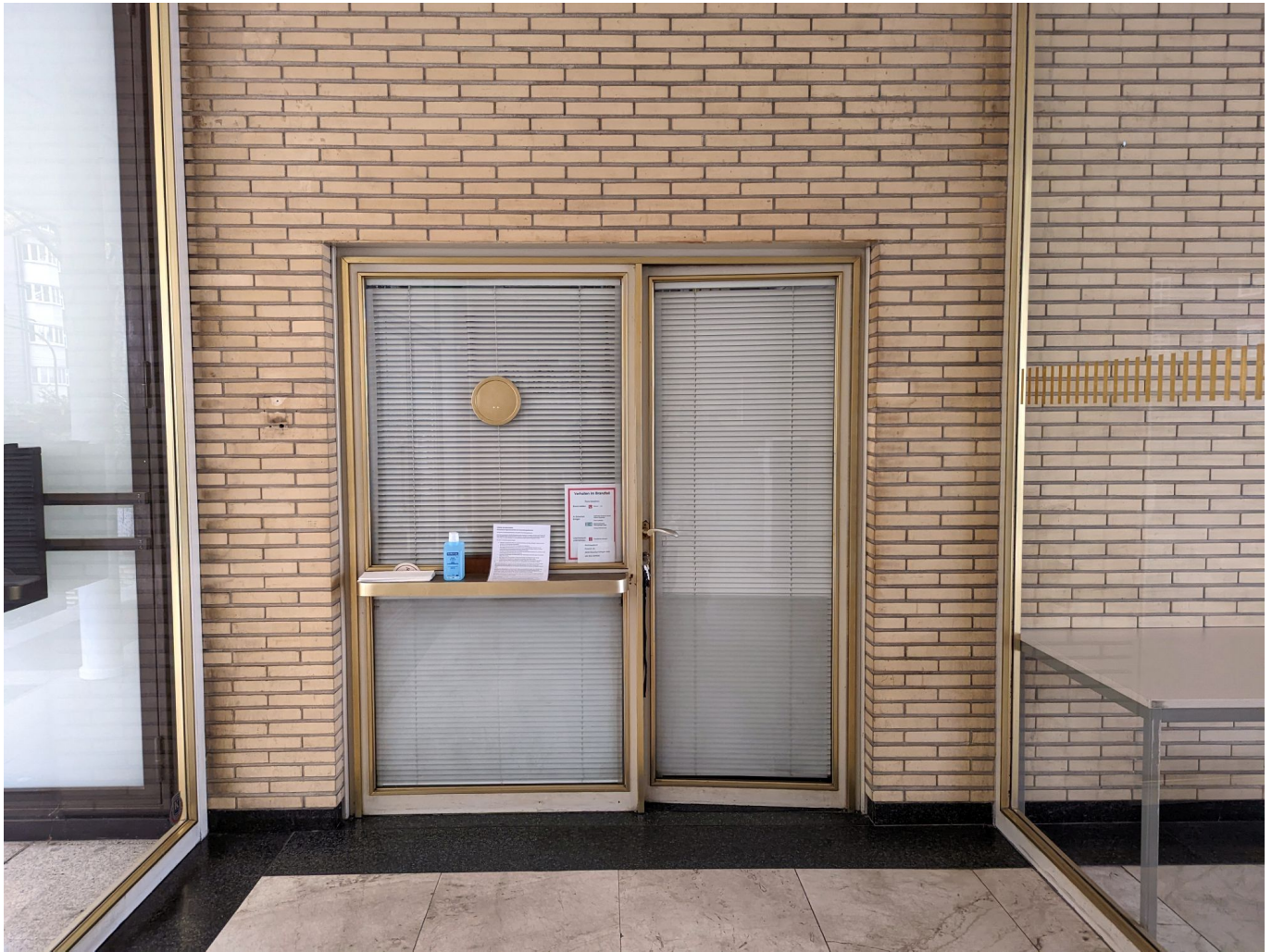
Klassische Pförtnerloge im Drahtaus

Im Haus selbst hört das Staunen nicht auf, denn nicht nur die repräsentativen Sitzungssäle im Erdgeschoss sind im Stil des Baus erhalten, überall findet man Details, die an diese Zeit erinnern - zum Beispiel der Haupteingang und die Pförtnerloge. Nur mit einer technischen Innovation kamen und kommen die Menschen, die im Drahtaus arbeiten, nicht gut zurecht. Weil die Technik der Fußbodenheizung noch nicht so weit war und man auf Heizkörper zugunsten der Optik verzichten wollte, entschied man sich für eine Deckenheizung. Heute weiß man, dass es fürs Raumklima weniger günstig ist, wenn die Wärme von oben kommt. Also bemüht man sich seit einiger Zeit, das Haus auf eine Fußbodenheizung umzurüsten.