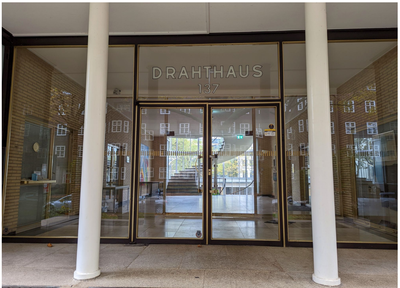
Der Haupteingang des Drahthauses

Das Drahthaus ist ein Gesamtkunstwerk, denn die klare und deutliche Formensprache findet sich im Inneren überall wieder. Es ist ein Segen, dass das Haus 1990 unter der Nummer A1212 in die Liste der Düsseldorfer Baudenkmäler eingetragen wurde und so vor Veränderungen oder gar dem Abriss geschützt ist. Immer noch dient es dem Bundesverband Draht als Hauptquartier, auch wenn inzwischen andere Mieter – für die Kaiserswerther Straße typisch handelt es sich vorwiegend um Firmen der Modebranche – beherbergt. Dass der Bau so schnell und so konsequent entlang der Entwürfe und Planungen fertiggestellt wurde, hat auch damit zu tun, dass sich seinerzeit sämtliche Verbände der Drahtindustrie auf das Projekt einigten und die Finanzierung sicherstellten.