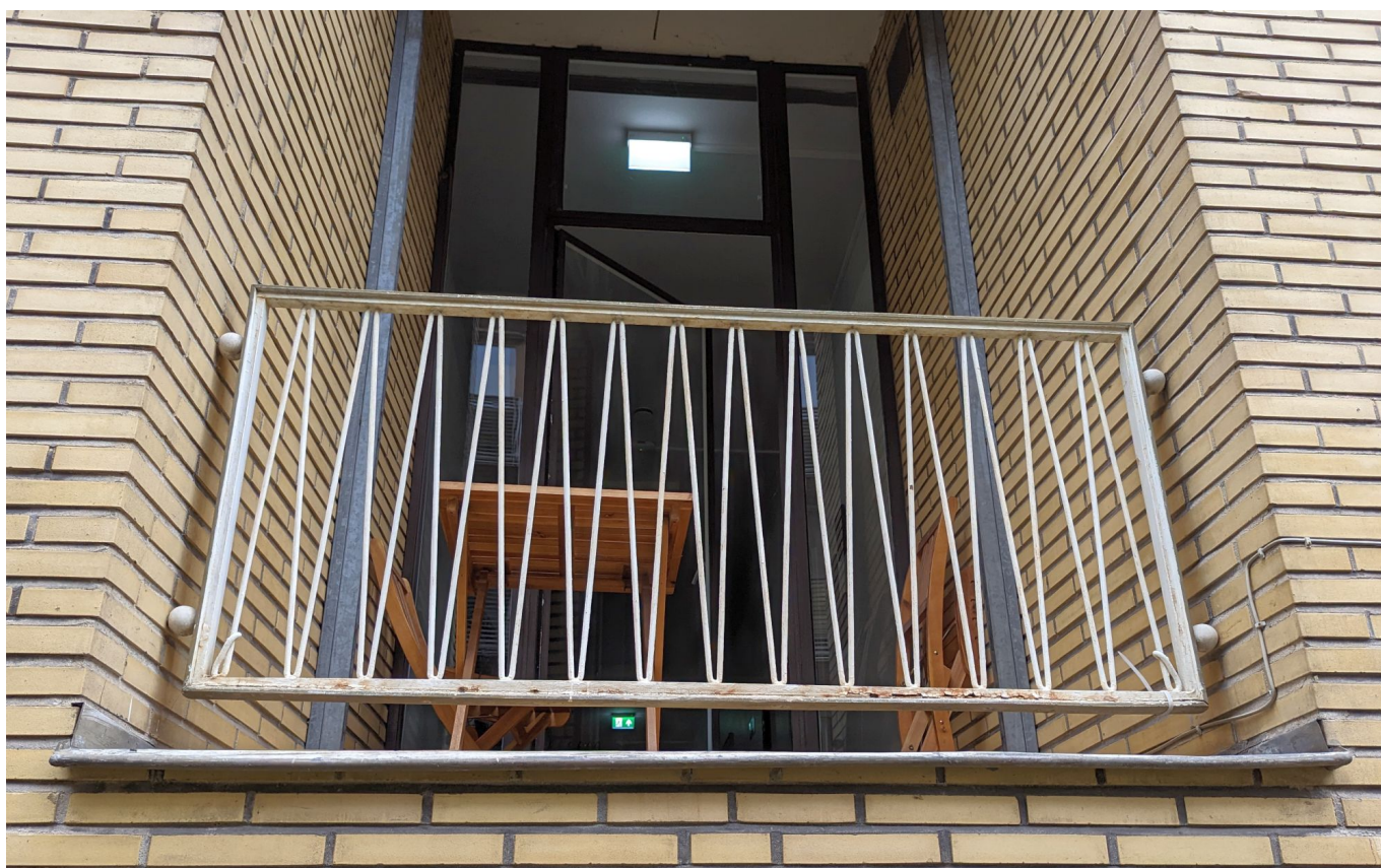
Geländer aus Draht – passend zum Zweck des Drahthauses

Und das gilt nicht nur für den Stil, sondern auch für die angewendeten Verfahren und Techniken. Geradezu revolutionär die Idee, die Geschosdecken nicht innerhalb des Gebäudes durch Mauerwerk oder Betonstützen abzustützen, sondern außen an schlanken Säulen aufzuhängen. Dabei nahm man Mannesmann-Rohre her, die mit Beton gefüllt wurden. Das erst ermöglichte die filigrane Fassade mit den breiten Bändern fast raumhoher Fenster. Auch das leicht überkragende Flachdach war hochmodern und stilbildend. Genau wie die ockerfarbigen Klinker, die sowohl außen als auch innen den Gesamteindruck des Drahthauses prägen. Für damalige Verhältnisse völlig ungewöhnlich auch das Treppenhaus. Es befindet sich zur Hälfte außerhalb des Baukörpers innerhalb einer halbrunden, verglasten Konstruktion und enthält vermutlich die deutschlandweit erste, an einem Stück gegossene Betontreppe. Ein Detail fällt nur aufmerksamen Betrachtern ins Auge. Die Geländer der Austritte vor den Fenstern bestehen aus Draht, der im gleichmäßigen Rhythmus zwischen waagerechten Stangen gespannt ist.