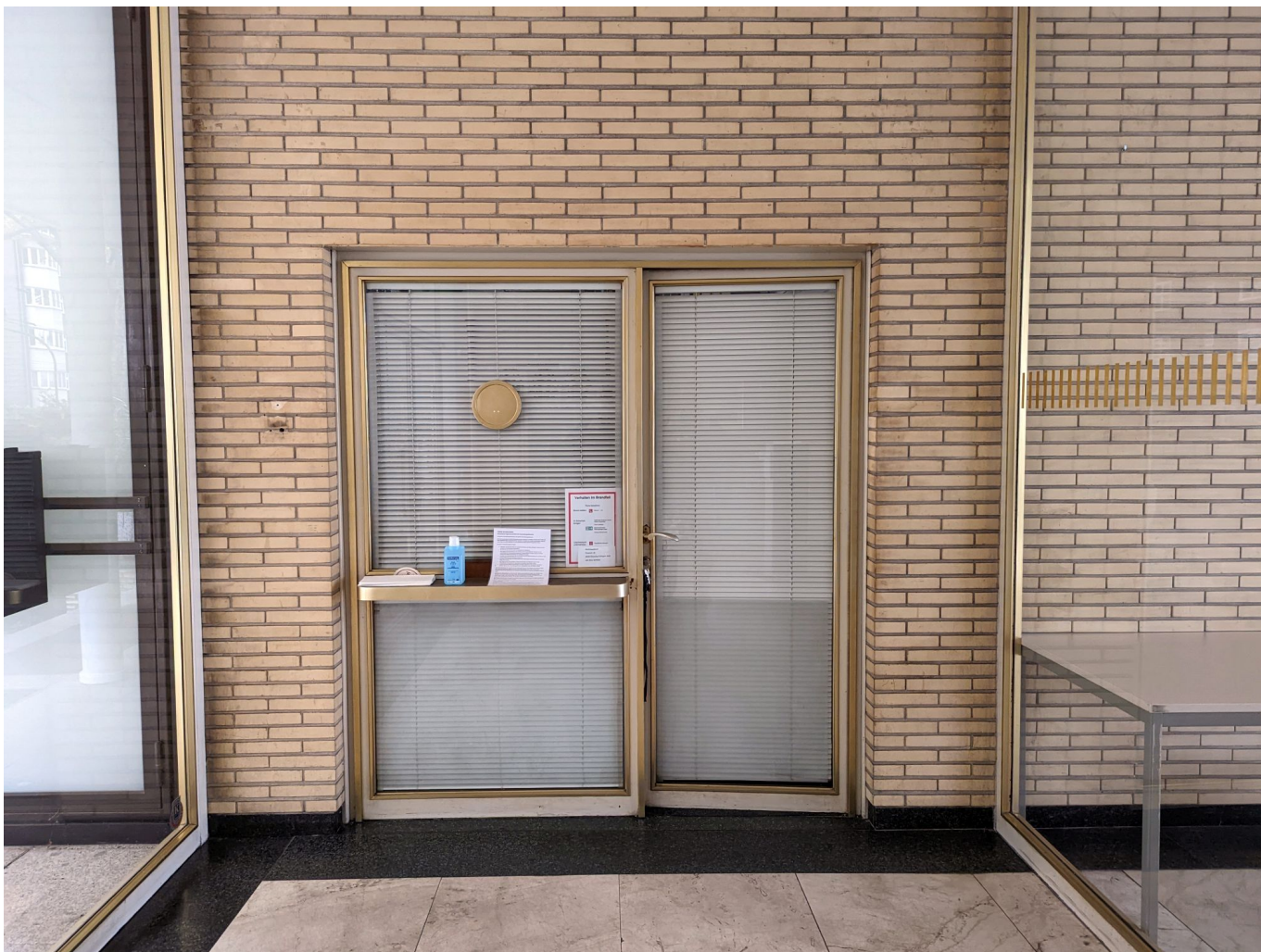
Klassische Pförtnerloge im Drahthaus

Im Haus selbst hört das Staunen nicht auf, denn nicht nur die repräsentativen Sitzungssäle im Erdgeschoss sind im Stil des Baus erhalten, überall findet man Details, die an diese Zeit erinnern – zum Beispiel der Haupteingang und die Pförtnerloge. Nur mit einer technischen Innovation kamen und kommen die Menschen, die im Drahthaus arbeiten, nicht gut zurecht. Weil die Technik der Fußbodenheizung noch nicht so weit war und man auf Heizkörper zugunsten der Optik verzichten wollte, entschied man sich für eine Deckenheizung. Heute weiß man, dass es fürs Raumklima weniger günstig ist, wenn die Wärme von oben kommt. Also bemüht man sich seit einiger Zeit, das Haus auf eine Fußbodenheizung umzurüsten.