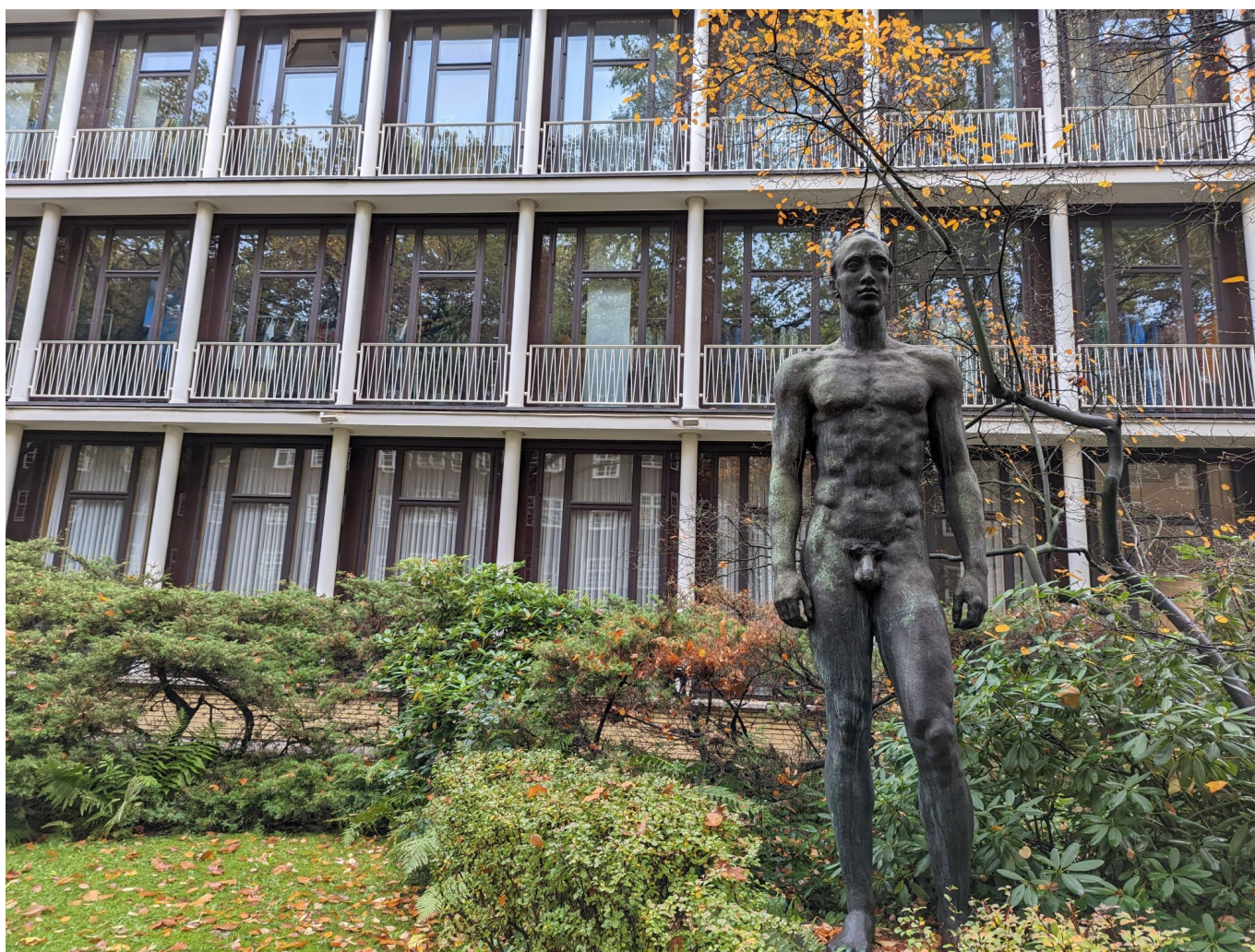
Der stehende Jüngling von Georg Kolbe am Drahthaus

als notwendiges Übel ansieht, sondern als Lebenselement freudig bejaht.“ Ein Satz, der den Optimismus der frühen Jahre der deutschen Demokratie auf den Punkt bringt. Stein des Anstoßes aber wurde ein paar Jahre lang die Skulptur des Berliner Bildhauers Georg Kolbe, die im Vorgarten rechts gegenüber dem Haupteingang versetzt aufgestellt wurde. Die 3,5 Meter hohe Bronze, das letzte Werk von Kolbe, trägt den Titel „Stehender Jüngling“, war und ist aber in der Nachbarschaft einfach als „der nackte Mann“ bekannt. In den ersten Jahren nahmen die Anwohner Anstoß, vor allem am deutlich sichtbaren Geschlechtsteil, und machten sich Sorgen wegen der moralischen Gefährdung ihrer Kinder. So wurde die fragliche Stellen ein ums andere Mal durch Lappen und Tücher unsichtbar gemacht.