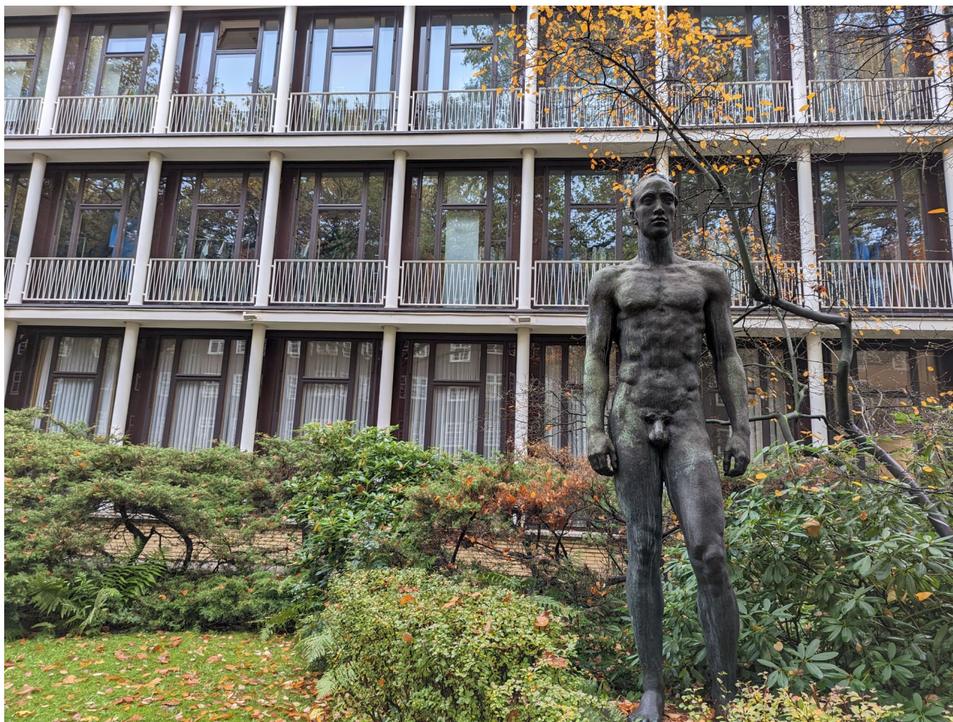
Der stehende Jüngling von Georg Kolbe am Drahthaus

als notwendiges Übel ansieht, sondern als Lebenselement freudig bejaht.“ Ein Satz, der den Optimismus der frühen Jahre der deutschen Demokratie auf den Punkt bringt. Stein des Anstoßes aber wurde ein paar Jahre lang die Skulptur des Berliner Bildhauers Georg Kolbe, die im Vorgarten rechts gegenüber dem Haupteingang versetzt aufgestellt wurde. Die 3,5 Meter hohe Bronze, das letzte Werk von Kolbe, trägt den Titel „Stehender Jüngling“, war und ist aber in der Nachbarschaft einfach als „der nackte Mann“ bekannt. In den ersten Jahren nahmen die Anwohner Anstoß, vor allem am deutlich sichtbaren Geschlechtsteil, und machten sich Sorgen wegen der moralischen Gefährdung ihrer Kinder. So wurde die fragliche Stellen ein ums andere Mal durch Lappen und Tücher unsichtbar gemacht.