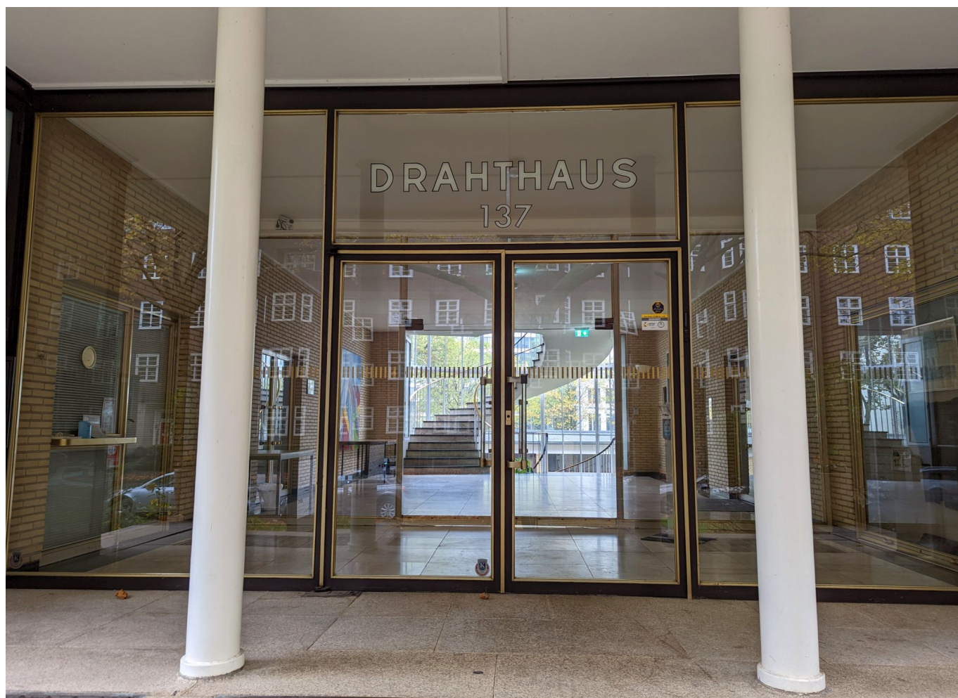
Der Haupteingang des Drahthauses

Das Drahthaus ist ein Gesamtkunstwerk, denn die klare und deutliche Formensprache findet sich im Inneren überall wieder. Es ist ein Segen, dass das Haus 1990 unter der Nummer A1212 in die Liste der Düsseldorfer Baudenkmäler eingetragen wurde und so vor Veränderungen oder gar dem Abriss geschützt ist. Immer noch dient es dem Bundesverband Draht als Hauptquartier, auch wenn inzwischen andere Mieter – für die Kaiserswerther Straße typisch handelt es sich vorwiegend um Firmen der Modebranche – beherbergt. Dass der Bau so schnell und so konsequent entlang der Entwürfe und Planungen fertiggestellt wurde, hat auch damit zu tun, dass sich seinerzeit sämtliche Verbände der Drahtindustrie auf das Projekt einigten und die Finanzierung sicherstellten.