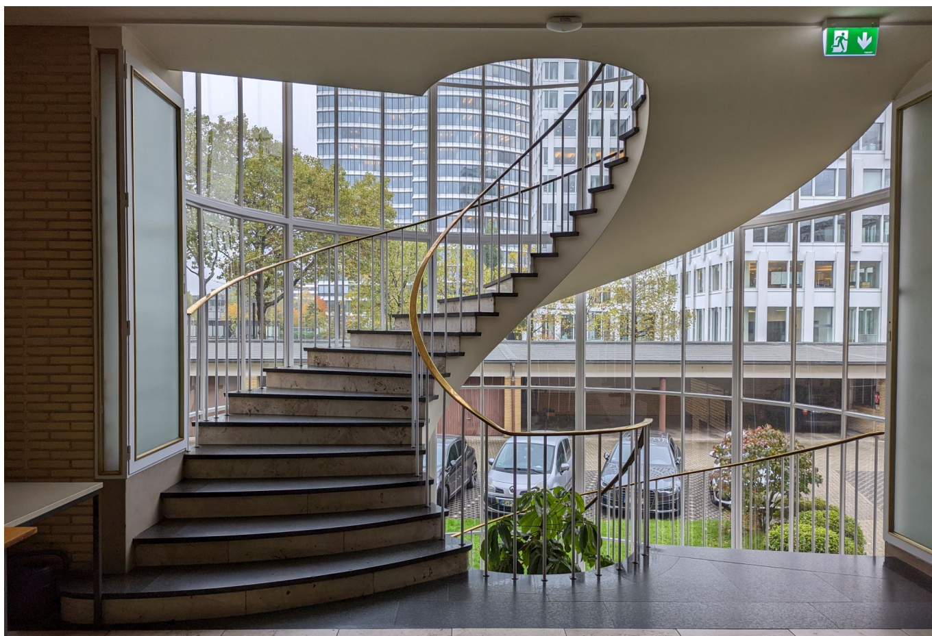
Die fein geschwungene Treppe im Drahthaus