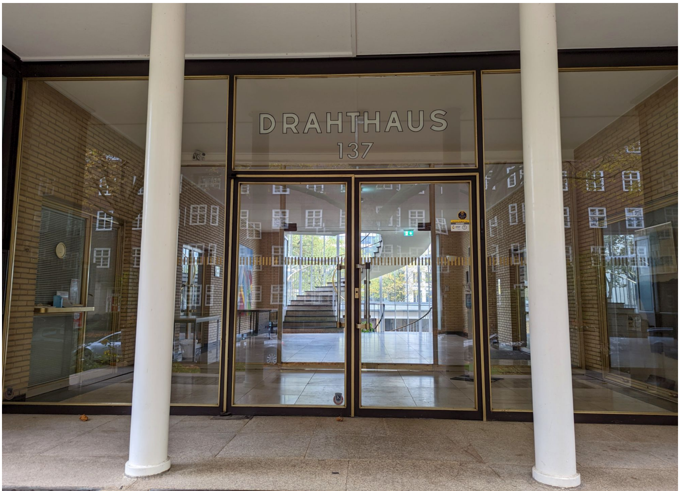
Der Haupteingang des Drahthauses

Das Drahthaus ist ein Gesamtkunstwerk, denn die klare und deutliche Formensprache findet sich im Inneren überall wieder. Es ist ein Segen, dass das Haus 1990 unter der Nummer A1212 in die Liste der Düsseldorfer Baudenkmäler eingetragen wurde und so vor Veränderungen oder gar dem Abriss geschützt ist. Immer noch dient es dem Bundesverband Draht als Hauptquartier, auch wenn inzwischen andere Mieter – für die Kaiserswerther Straße typisch handelt es sich vorwiegend um Firmen der Modebranche – beherbergt. Dass der Bau so schnell und so konsequent entlang der Entwürfe und Planungen fertiggestellt wurde, hat auch damit zu tun, dass sich seinerzeit sämtliche Verbände der Drahtindustrie auf das Projekt einigten und die Finanzierung sicherstellten.