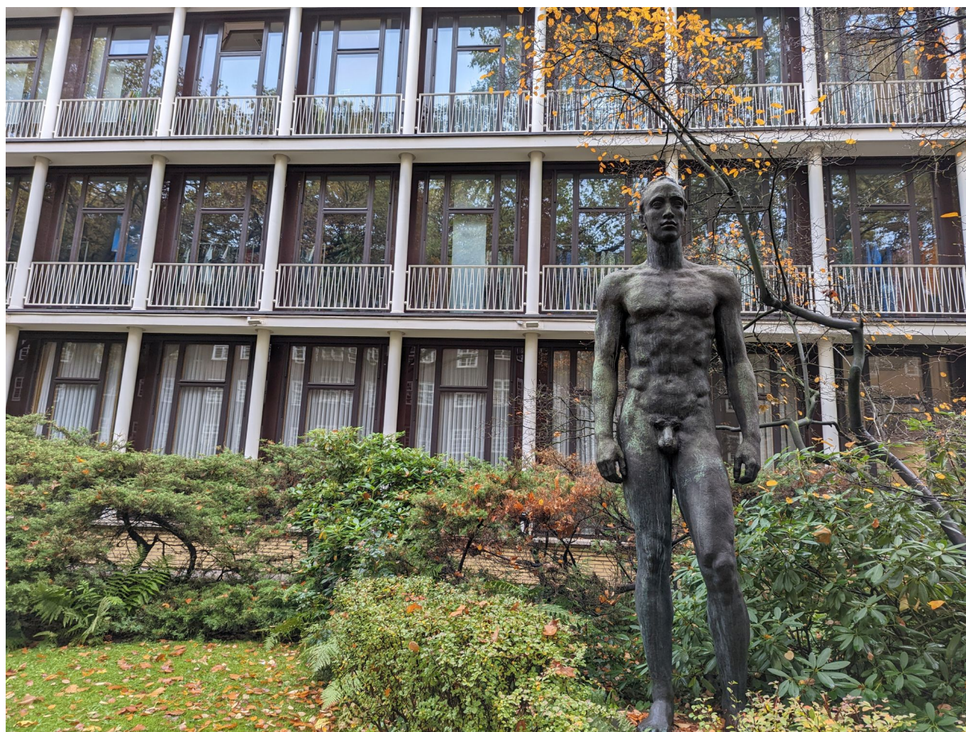
Der stehende Jüngling von Georg Kolbe am Drahthaus

als notwendiges Übel ansieht, sondern als Lebenselement freudig bejaht.“ Ein Satz, der den Optimismus der frühen Jahre der deutschen Demokratie auf den Punkt bringt. Stein des Anstoßes aber wurde ein paar Jahre lang die Skulptur des Berliner Bildhauers Georg Kolbe, die im Vorgarten rechts gegenüber dem Haupteingang versetzt aufgestellt wurde. Die 3,5 Meter hohe Bronze, das letzte Werk von Kolbe, trägt den Titel „Stehender Jüngling“, war und ist aber in der Nachbarschaft einfach als „der nackte Mann“ bekannt. In den ersten Jahren nahmen die Anwohner Anstoß, vor allem am deutlich sichtbaren Geschlechtsteil, und machten sich Sorgen wegen der moralischen Gefährdung ihrer Kinder. So wurde die fragliche Stellen ein ums andere Mal durch Lappen und Tücher unsichtbar gemacht.