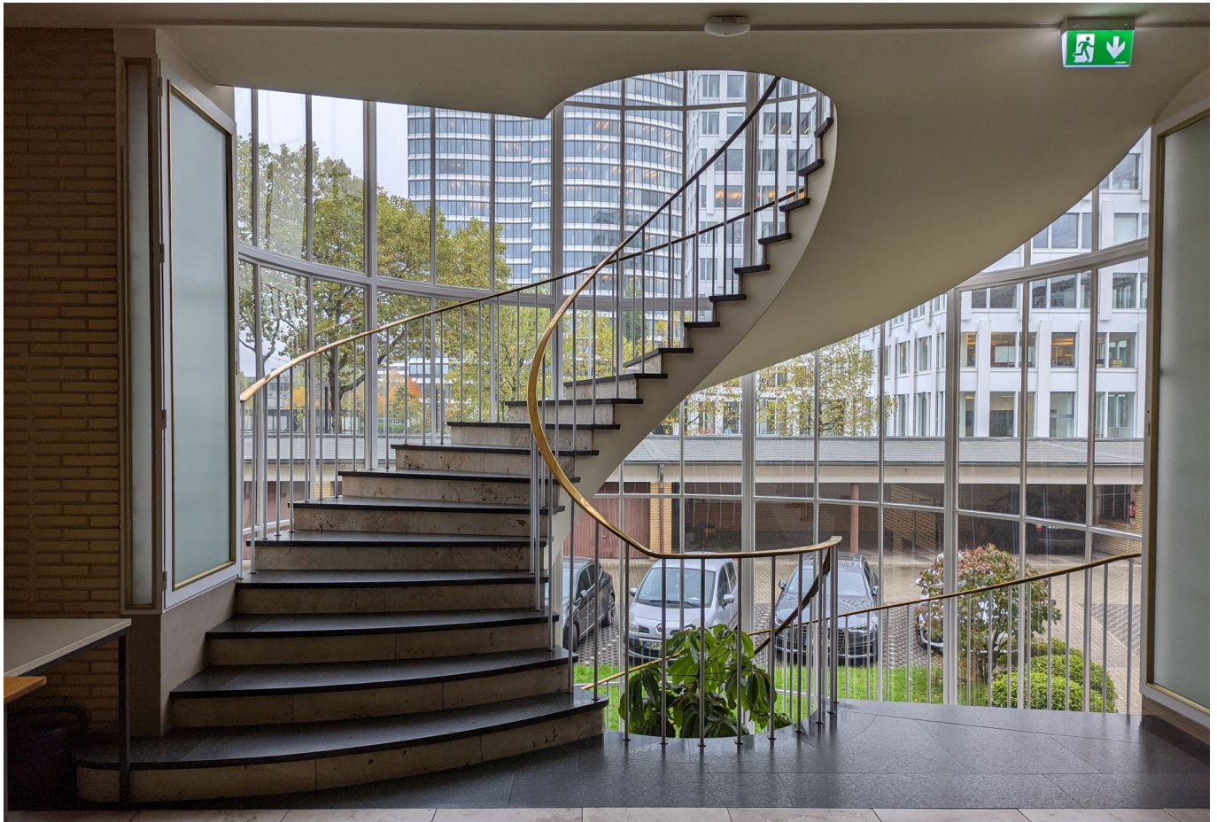
Die fein geschwungene Treppe im Drahthaus