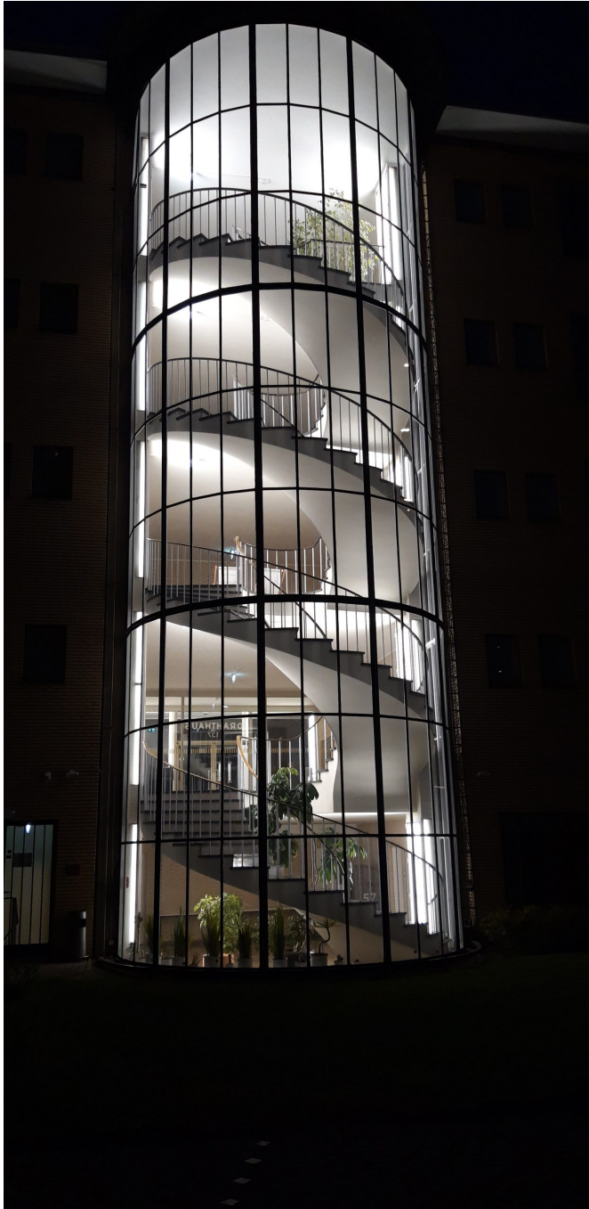
Das wunderschöne Treppenhaus von außen bei Nacht

Das Drahthaus lässt sich nicht nur als herausragendes Beispiel für den Baustil des neuen, demokratischen Deutschlands lesen, sondern auch als Gegenentwurf zu Bauten im NS-Stil wie sie Schulte-Frohlinde – unter anderem mit der Alten Kämmerei am Marktplatz – forcierte.