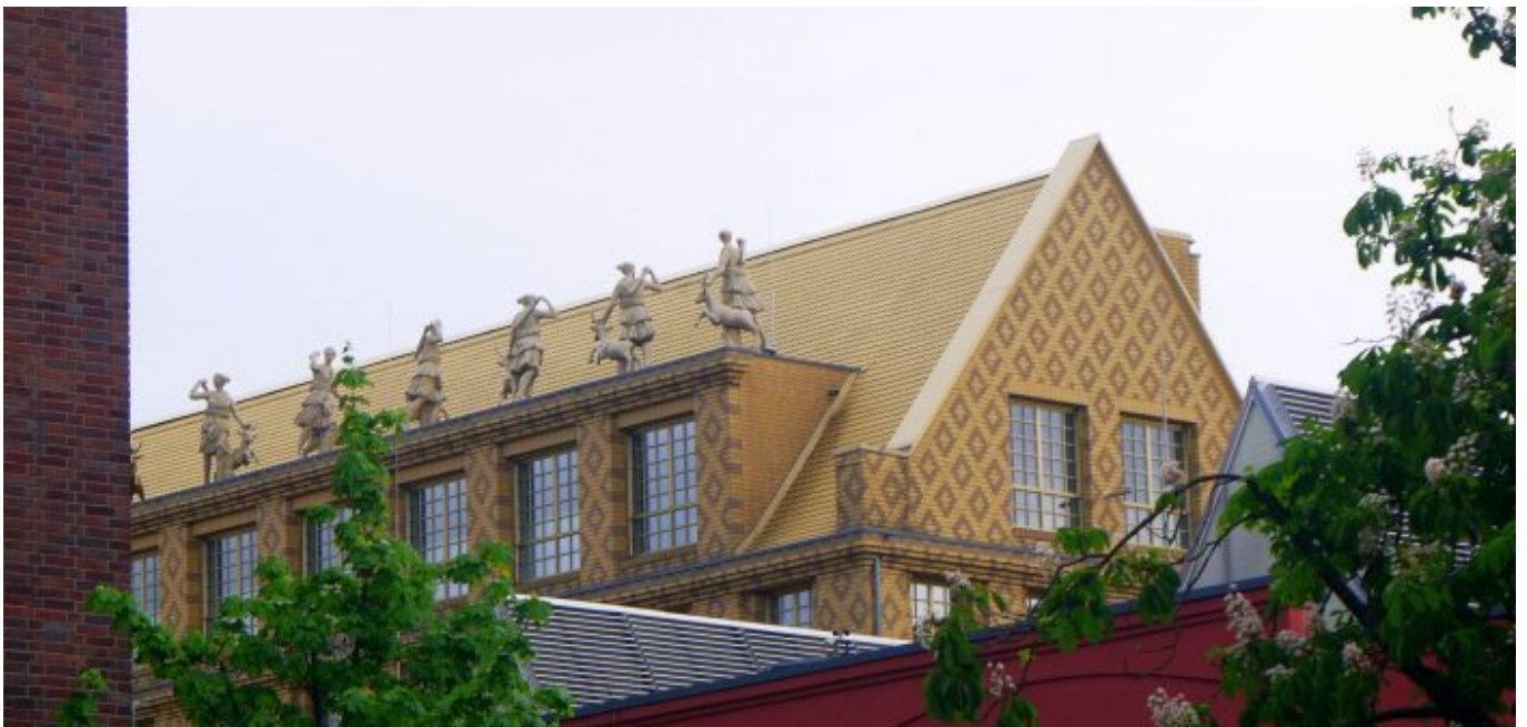
Das gelbe Haus: Jagdszenen auf dem Dachsim

Unterstützt TD! Dir gefällt, was wir schreiben? Du möchtest unsere Arbeit unterstützen? Nichts leichter als das! Unterstütze uns durch das Abschließen eines Abos (monatlich ab 3 Euro, jederzeit kündbar) oder durch den einmaligen Kauf einer Lesebeteiligung in beliebiger Höhe - und zeige damit, dass The Düsseldorf dir etwas wert ist.