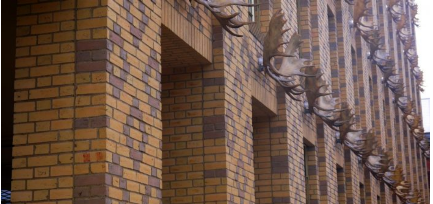
Das Gelbe Haus: Elchschaufeln in Reih und Glied