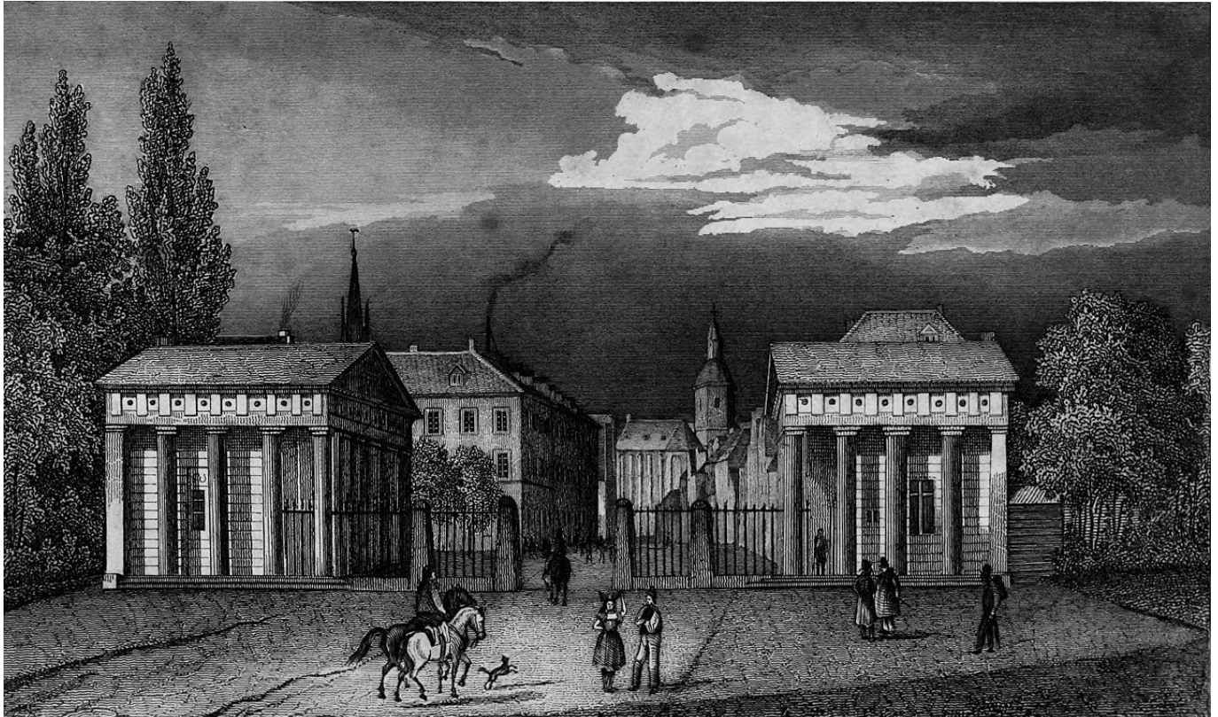
Das Ratinger Tor um 1838 (Stich von Johann Wilhelm Spitz via Wikimedia)

Unterstützt TD! Dir gefällt, was wir schreiben? Du möchtest unsere Arbeit unterstützen? Nichts leichter als das! Unterstütze uns durch das Abschließen eines Abos oder durch den Kauf einer Lesebeteiligung – und zeige damit, dass The Düsseldorfer dir etwas wert ist.