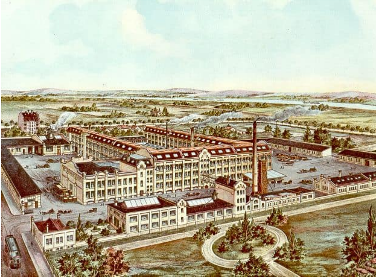
Künstlerische Darstellung des Jagenberg-Werks in Bilk von 1906

Tatsächlich wurde 1906 zunächst das zentrale Verwaltungsgebäude fertig; die Produktion lief weiter auf den Firmengeländen an der Reichs- und der Konkordiastraße sowie bei der