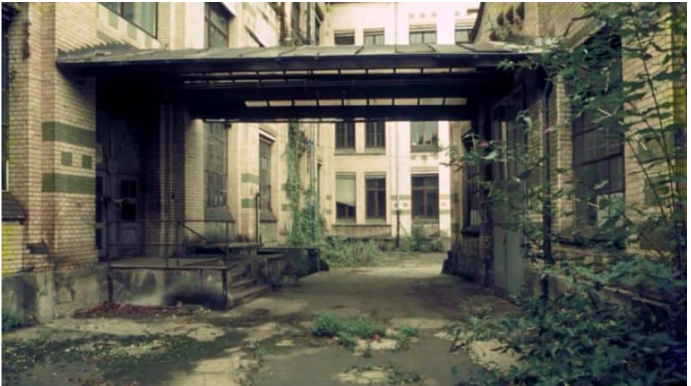
So sah es in der Jagenberg-Fabrik nach dem Aus in den 80ern aus

Abriss der Salzmann-Bauten plante, um das Grundstück Immobilienentwicklern in die Hände zu geben, die dort vor allem Büros und Luxuswohnungen errichten wollten. Tatsächlich aber bezogen schon im Winter nach dem Beginn des Leerstands Düsseldorfer Künstler:innen illegal Teile des mittleren Querflügels, um die Räume als Ateliers und für Ausstellungen zu nutzen.