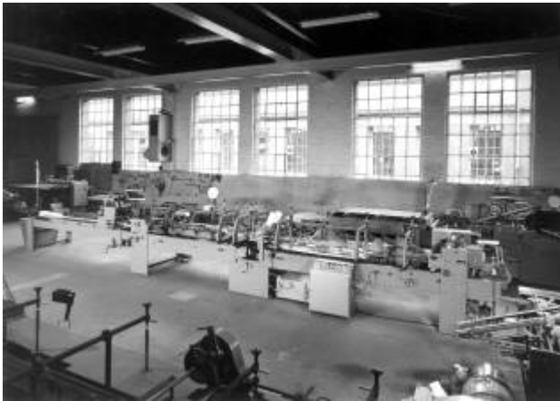
So sah es in den Jagenberg-Hallen im Salzmannbau aus

musste die Firma umziehen, und um 1900 herum war klar, dass man auf einem ausreichend großen Gelände eine neue Fabrik würde errichten müssen, die zudem von Beginn an auf Erweiterung ausgerichtet war.