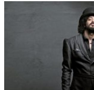
Insaniya – Yemen Blues