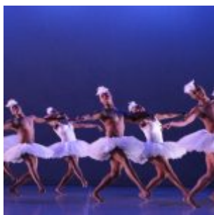
Swan Lake - Dada Masilo / The Dance Factory

Es ist einzigartig und das seit mittlerweile 26 Jahren: Das Düsseldorf Festival, das bis vor ein paar Jahren „Altstadtherbst“ hieß. Immer und immer wieder überrascht das Programm mit Perlen aus den Bereichen Musik, Theater, Tanz und Neuer Zirkus, und mancher mittlerweile weltberühmte Künstler hat seinen ersten großen Auftritt auf diesem Festival gehabt. Zum Beispiel Ravid Kahalani, der mit seiner Band „Yemen Blues“ 2010 ein grandioses Konzert im Festivalzelt auf dem Burgplatz präsentierte; er wird in diesem Jahr am 03.10. das Festival abschließen. Auch der durch und durch ungewöhnliche Cirkus Cirkör aus Schweden ist schon seit Längerem mit dem Festival verbunden und bringt dieses Mal sein Stück „Limits“, das mit den Mitteln des Neuen Zirkus die politischen Fragen der Flüchtlingsbewegung kommentiert.