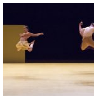
Mass B - Fêtes galantes

Ein Highlight, auf das sich die Festivalmacher besonders freuen, ist sicher der Gig der kongenialen Schweizer Musikerin Sophie Hunger , die Ausschnitte aus ihrem breiten Repertoire zwischen Folk, Chanson, Jazz und Rock erstmals mit einer ungewöhnlichen Besetzung und im intimen Rahmen singen und spielen wird. Alte Bekannte sind dagegen Matthias Brandt und Jens Thomas , die noch nicht so richtig verraten wollen, was sie im Festivalzelt anstellen werden.