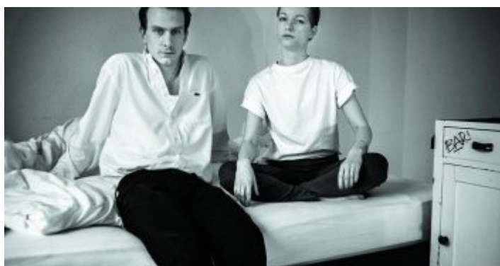
BAR, die Band Am Rhein, spielt in der Bergerkirche