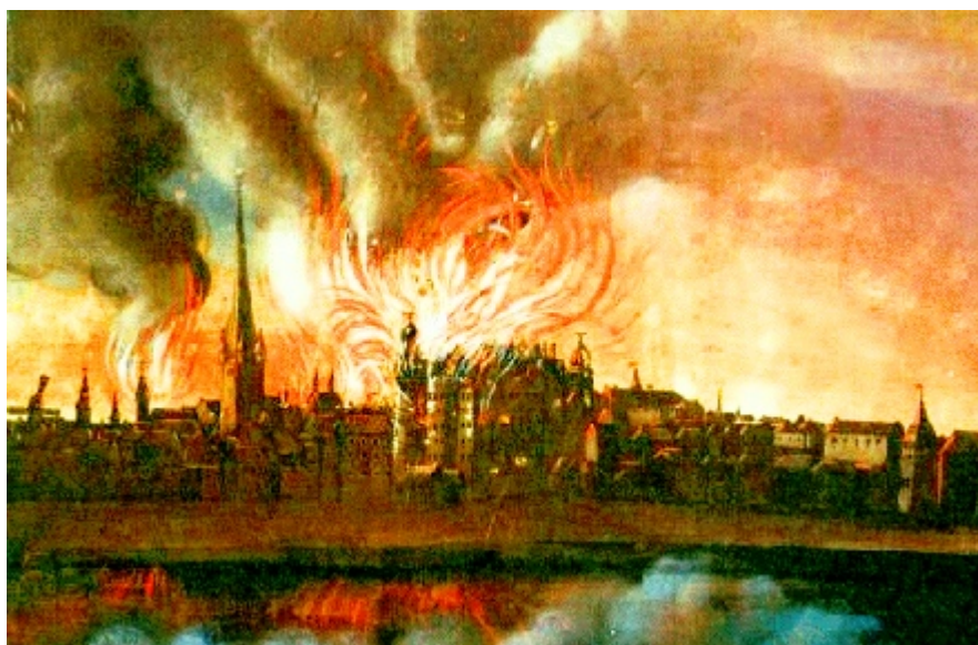
Brand der Stadt nach dem Beschuss durch die Franzosen am 6.10.1794

das hatte sich beim Koalitionsgeplänkel so ergeben. Die mit Preußen verbündeten Hannoveraner begannen die Stadt vom linksrheinischen Ufer aus zu beschießen und sorgten für erhebliche Schäden im Nordwesten Düsseldorfs. Auf Befehl des Kurfürsten zogen sich die Verteidiger zurück und überließen die Stadt den Angreifern kampflos. Und wieder ging es hin und her: Schon im August des Jahres vertrieben französische Truppen die Hannoveraner, übernahmen die Garnison und blieben bis März 1763 in der Stadt.