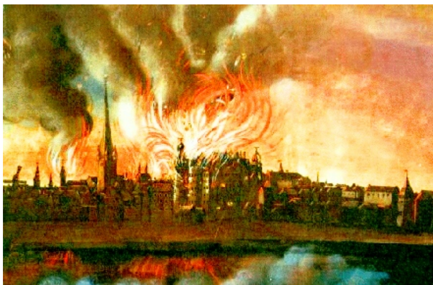
Brand der Stadt nach dem Beschuss durch die Franzosen am 6.10.1794

das hatte sich beim Koalitionsgeplänkel so ergeben. Die mit Preußen verbündeten Hannoveraner begannen die Stadt vom linksrheinischen Ufer aus zu beschießen und sorgten für erhebliche Schäden im Nordwesten Düsseldorfs. Auf Befehl des Kurfürsten zogen sich die Verteidiger zurück und überließen die Stadt den Angreifern kampflos. Und wieder ging es hin und her: Schon im August des Jahres vertrieben französische Truppen die Hannoveraner, übernahmen die Garnison und blieben bis März 1763 in der Stadt.