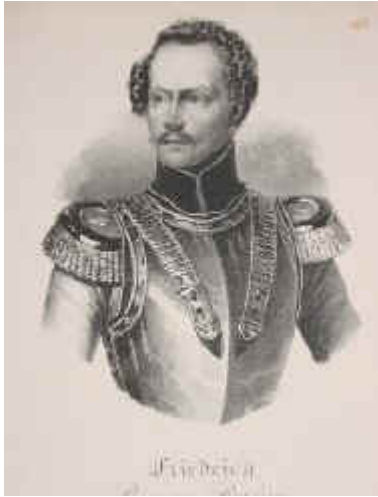
Friedrich Wilhelm von Preußen, Garnisonskommandant

Nach der Völkerschlacht bei Leipzig war das napoleonische Reich zusammengebrochen. Das aus strategischen Gründen von den Franzosen zum selbstständigen Staat außerhalb des Heiligen Römischen Reichs Deutscher Nation gemachte Großherzogtum Berg fiel an Preußen, das sofort begannen, aus Düsseldorf wieder eine Garnisonsstadt zu machen. So richtig hatten es die Düsseldorfer mit ihrer Jan-Wellem-Vergangenheit und ihrer lockeren, zivilisierten Haltung weder mit den Preußen, noch mit dem Militär. Nur dank diverser Image-Kampagnen der jeweils leitenden Offiziere wurden die Soldaten und ihre Offiziere in der Stadt anerkannt, und ab etwa 1848 kam es sogar zu Ehen zwischen preußischen Militärs und Düsseldorfer Bürgertöchtern. Drei Verbände lagen nun in Düsseldorfer Kasernen: das 5. westfälische Ulanen-Regiment, das 11. Husaren-Regiment und das Niederrheinisches Füsilier-Regiment Nr. 39. Die größte Kaserne stand außerhalb der alten Stadtbefestigung östlich der Carlstadt etwa da, wo heute die Kasernenstraße(sic!) verläuft, der große Exerzierplatz lag ungefähr da, wo heute die Königsallee ist.