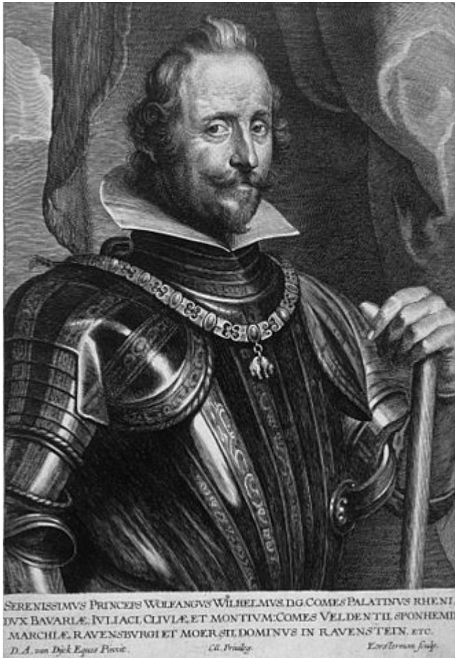
Pfalzgraf Wolfgang Wilhelm

Wolfgang Wilhelm, der den größten Teil seines Lebens in Düsseldorf verbrachte und über ein einigermaßen zersplittertes Territorium herrschte, gelang es, seinen Staat für neutral zu erklären. Viel wichtiger wurde das im Dreißigjährigen Krieg (1618 bis 1648), in dem die Fronten nie ganz klar waren und der eigentliche Grund des Krieges auch nicht. Heimlich zum Katholizismus konvertiert lavierte der Herzog zwischen den Mächten und erreichte es, dass die Stadt selbst beinahe vollständig vom Krieg verschont blieb, ohne je militärisch eingegriffen zu haben. Tatsächlich begründete er erst 1615 eine kleine Garnison mit einem winzigen „stehenden Heer“ von gerade einmal dreihundert Mann. Dass überhaupt Militär in die Stadt kam, führte übrigens zu einer der größten Katastrophen in der Geschichte Düsseldorfs: Am 10. August 1634 explodierte aufgrund von Blitzschlag der Pulverturm am Nordwestende der Stadtmauer und legte weite Teil der Stadt in Schutt und Asche.