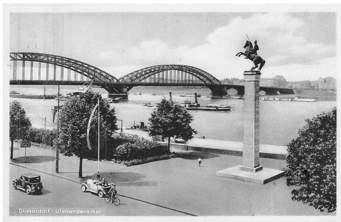
Das Ulanendenkmal am Rheinufer um 1942 auf einer Postkarte

gegenüber 1880 auf mehr als 200.000 verdoppelt. Derendorf wurde nun nicht nur Wohngebiet, sondern auch Industriestandort. Kein Wunder also, dass mit den Rheinmetall-Werken gleich gegenüber ein Rüstungsbetrieb errichtet wurde, der dank zweier Patente für nahtlos gezogene Rohre rasch zu einem der wichtigsten Lieferanten von Kanonen und Geschützen entstand. Mit der industriellen Revolution hatte auch die industrielle Fertigung von Material fürs Militär eingesetzt. Begonnen hatte die Vorgängerfirma von Rheinmetall mit der Herstellung von Munition.