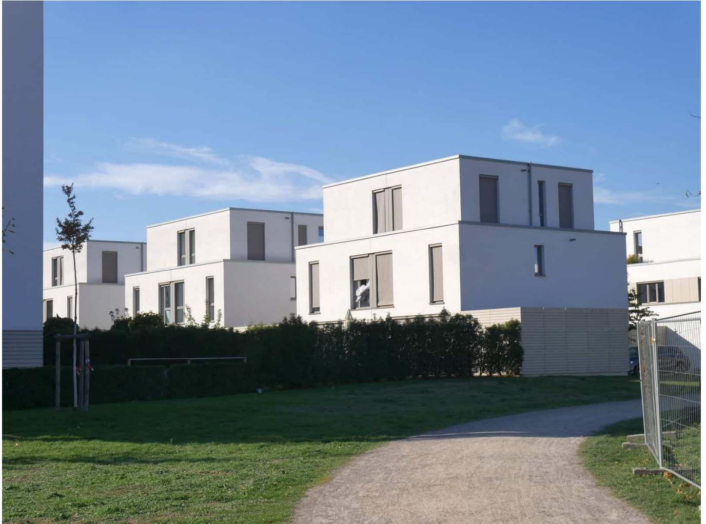
Gartenstadt Reitzenstein: Ein Hauch von Science Fiction

Die Nazi-Wehrmacht bezog 1937 die neu errichtete Reitzenstein-Kaserne in Mörsenbroich. 1936 war oberhalb der Knittkuhl eine Flak-Kaserne entstanden, die stetig erweitert ab 1960 von der Bundeswehr genutzt und dann Bergische Kaserne genannt wurde. Aus der Kaserne in Mörsenbroich wurde vor einigen Jahren ein neues Wohngebiet namens Gartenstadt Reitzenstein. Auch die Bergische Kaserne soll über kurz oder lang als Neubaugebiet genutzt werden. Von der Reitzenstein-Kaserne ist noch das Karrierezentrum der Bundeswehr geblieben. Hinzu kommen, teils am selben Standort, verschiedene Verwaltungseinrichtungen; Truppen sind derzeit in Düsseldorf nicht mehr stationiert. Damit endete in den 2010er-Jahren die 1615 mit einem „stehenden Heer“ von gerade einmal 300 Mann begonnene Ära als Garnisonsstadt nach rund 400 Jahren.