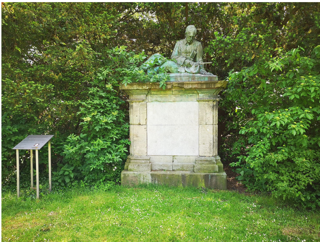
Das Kolonialkriegerdenkmal auf dem Frankenplatz

So wundert es nicht weiter, dass mehrere Denkmäler zu Ehren dieser Truppen nach wie vor im Stadtbild zu finden sind. Am bekanntesten sind das Ulanendenkmal am Rheinufer in der Nähe des Fortuna-Büchchens und das Kriegerdenkmal in Golzheim, das 1939 als Ersatz für die Gedenkstätte für die Düsseldorfer Füsiliere eingeweiht wurde und bis heute Pilgerstätte für Rechtsextreme geblieben ist. Weniger bekannt ist das Kolonialkriegerdenkmal am Frankenplatz, das den Füsiliern gewidmet ist, die in den Kolonialkriegen des Kaiserreichs gefallen sind.