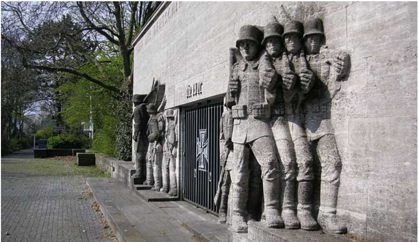
Das Kriegerdenkmal in Golzheim für das Niederrheinische Füsiliers-Regiments Nr. 39

nahtlos fort. Als Truppen der Wehrmacht ab 1936 wieder im Rheinland stationiert wurden, wurde auch die Ulanenkaserne erneut militärisch genutzt. Nach dem Zweiten Weltkrieg übernahm die Schutzpolizei einige der Gebäude und brachte hier unter anderem die Reiterstaffel unter.