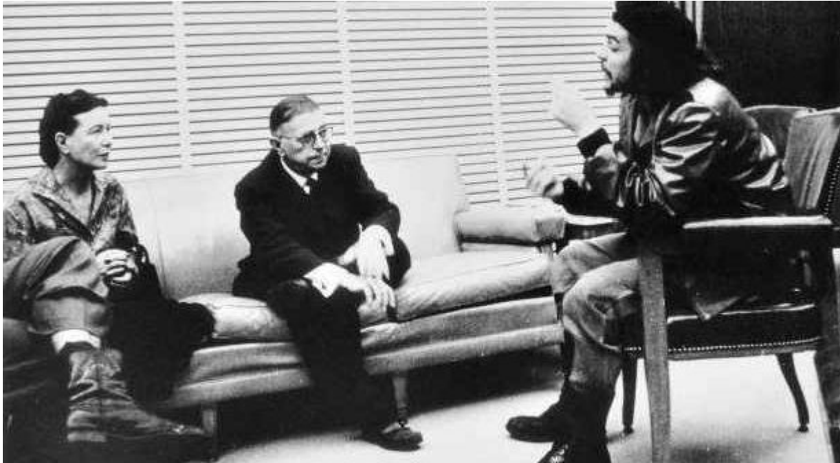
Beauvoir, Sartre und Che Guevara – das waren noch Existentialisten...