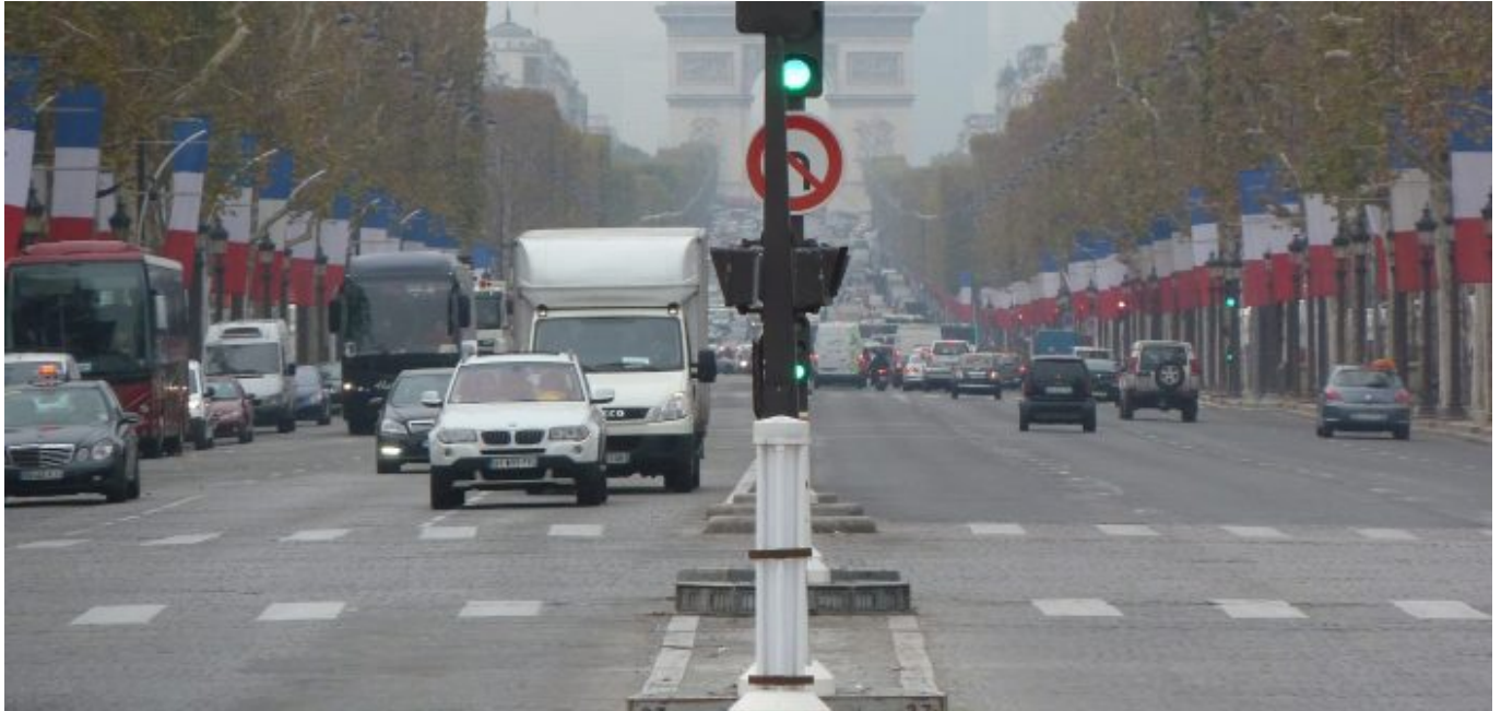
Paris - immer noch ein Sehnsuchtsort für Düsseldorfer

Nur: Französische Spuren fanden sich in Düsseldorf damals so gut wie keine. Zumal es auch keine nennenswerte französische Gemeinde in der NRW-Landeshauptstadt gab (und gibt). Französisch angehauchte Bistros in der Altstadt? Fehlanzeige. Französische Restaurants in der Stadt? Mangelware. Aber schon 1950 eröffnete die Düsseldorfer Dependance des 1949 als wichtigem Baustein der deutsch-französischen Freundschaft gegründeten Institut français , die nun schon seit Jahrzehnten im wunderschönen Palais Wittgenstein am Rande der Altstadt sitzt. Dort konnte man (kostenlose) Französischkurse belegen, dort entstand eine Bücherei und inzwischen bietet das Institut ein reiches Kulturprogramm (wenn die Corona-Pandemie nicht gerade dazwischenkommt).