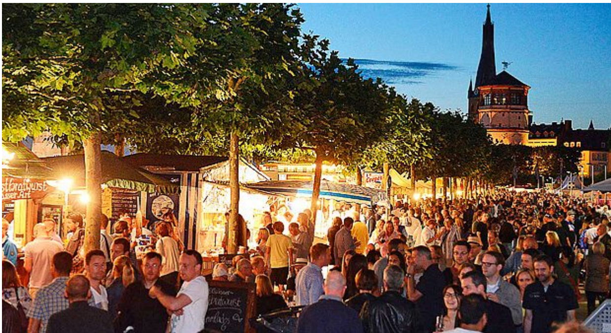
Savoir vivre: In der Altstadt beim Frankreichfest

Genau in dieser Phase zeigte sich aber eine andere Bewegung, in der unser späterer erster Bundeskanzler, der bereits erwähnte Konrad Adenauer, eine nicht unbedeutende Rolle spielte. Ermutigt durch die französische Besatzung und durch politische Kräfte in Frankreich und Belgien unterstützt träumten Separatisten von einer Rheinischen Republik, die losgelöst von den verhassten Preußen als eigenständiger Staat an Frankreich angelehnt existieren sollte. Das fanden die anderen Alliierten nicht witzig, sodass Frankreich und Belgien ihre Unterstützung zurückzogen. Mit eigenen Schutztruppen, die ihren Unterhalt durch Requirieren bei der eher unwilligen Bevölkerung bestritten hatten, versuchten die Separatisten ihre kurzen Sommer der Republik mit militärischer Gewalt zu verlängern, aber im November 1923 war der Traum ausgeträumt. Diese merkwürdige Phase in der Beziehung zwischen Frankreich und dem Rheinland hat allerdings kaum Spuren hinterlassen.