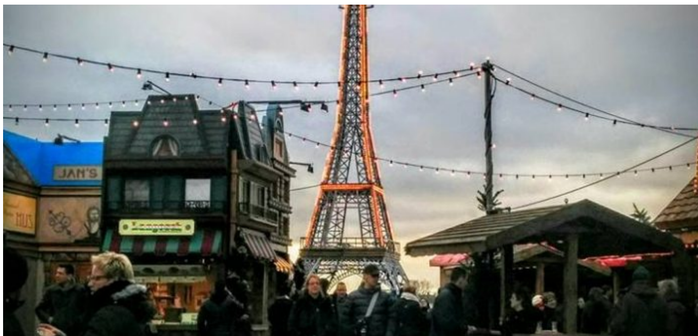
Das Frankreichfest auf dem Burgplatz

Und das, obwohl immer mehr Menschen ihren Urlaub an der französischen Mittelmeerküste verbrachten, in der Normandie und der Bretagne oder Gourmet-Touren durchs Elsass und die Auvergne unternahmen. Den französischen Nationalfeiertag am 14. Juli feierten bis weit in die Neunzigerjahre hinein nur Düsseldorfer mit persönlichen oder familiären Banden. Das änderte sich im Jahr 2000. Denn in jenem Sommer veranstaltete die Düsseldorfer Wirtschaftsförderung das erste Frankreichfest, das inzwischen fester Bestandteil des hiesigen Event-Kalenders ist (wenn die Corona-Pandemie nicht gerade dazwischenkommt). Nun war und ist dieses Fest eine durchaus kommerzielle Angelegenheit, aber eben auch die Gelegenheit für die Düsseldorfer*innen alles, was in der Stadt irgendwie französisch ist, kennenzulernen. So wird die deutsch-französische Freundschaft, die zwischendurch wenig sichtbar war, wieder belebt.