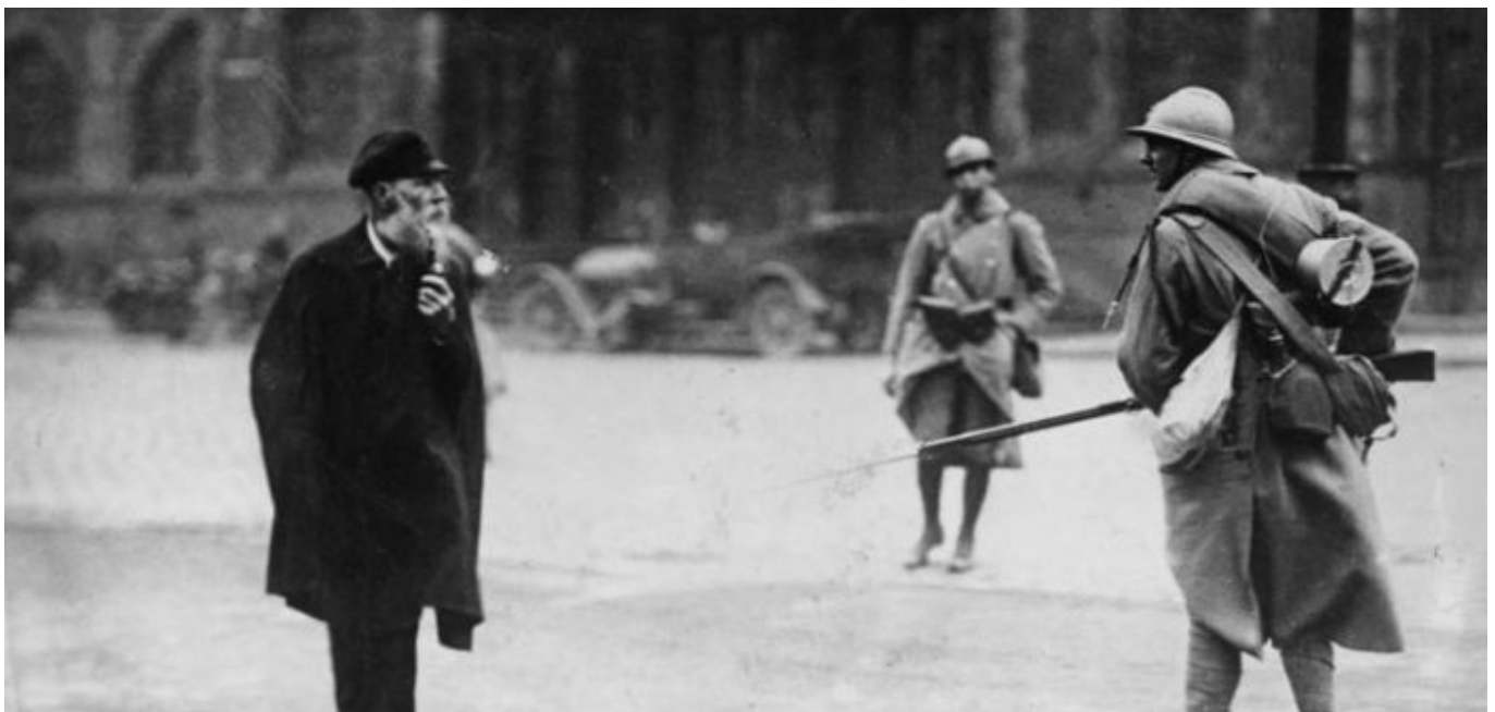
Mit gefällttem Bajonett gegen einen Greis.

von Paris, geschlossen, und die Franzosen fühlten sich nicht nur als Sieger, sondern ließen den Eroberer raushängen. So wurde das 1919 zur Republik gewordene Deutschland zu heftigen Reparationsleistungen verpflichtet, besonders zur stetigen Lieferung von Kohle, Stahl und Eisen aus dem Ruhrgebiet. Anfang 1923 behaupteten die Alliierten, Deutschland sei mit den Reparationsleistungen schwer im Rückstand und bezichtigten die politisch Verantwortlichen der Sabotage. Die militärische Besetzung des Ruhrgebiets und des rechtsrheinischen Rheinlands war die Konsequenz – dies war Wasser auf die Mühlen der sich breitmachenden Nationalsozialisten, die den Widerstand organisierten.