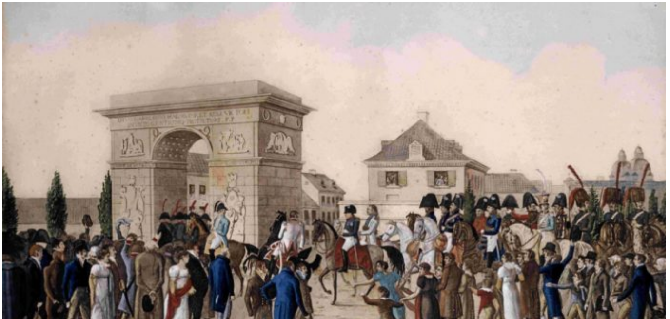
Triumphaler Empfang: Napoleon in Düsseldorf 1811

allerlei Bau- und Verschönerungsmaßnahmen führte, sodass die Bürger*innen den Kaiser 1811 durch mit Wohlwollen empfangen. Es war die flüchtige Begeisterung Napoleons für unser Städtchen, das den Spitznamen „Klein Paris“ begründete. Denn, seien wir ehrlich, die Ähnlichkeiten zwischen der Metropole an der Seine und unserem niedlichen Dorf an der Düssel sind bei näherer Betrachtung eher gering.