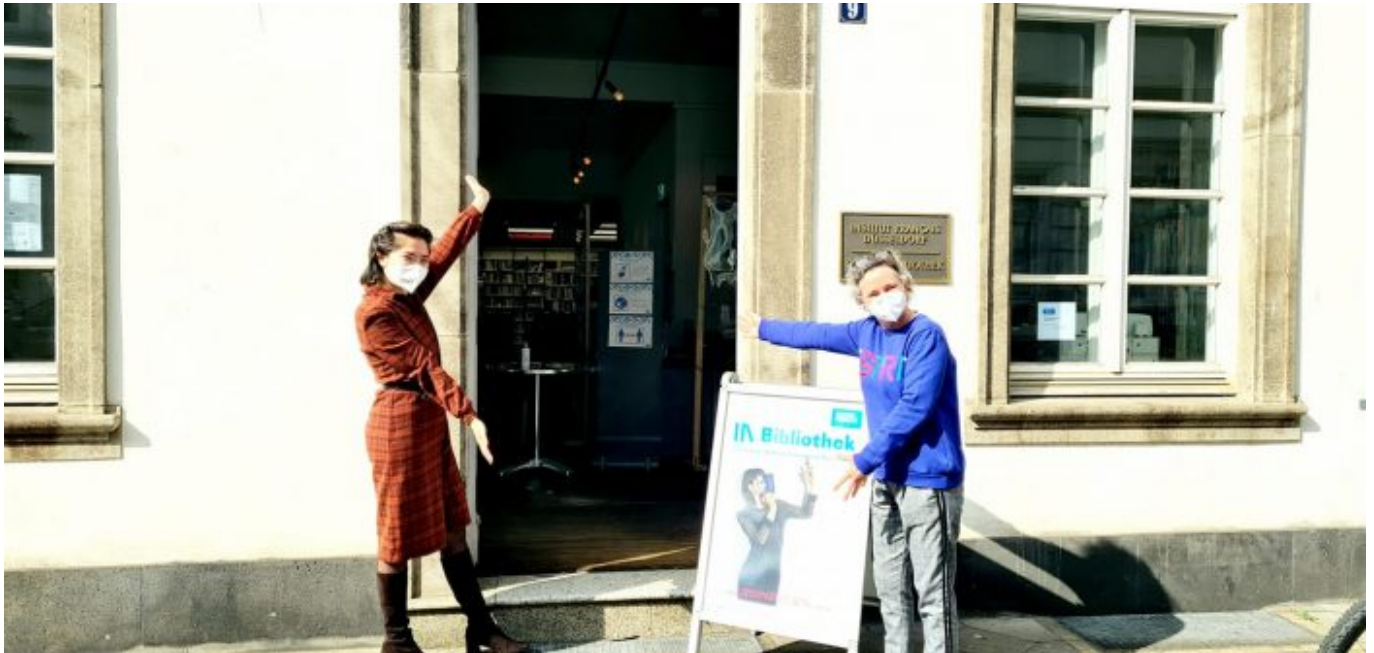
Das Institut francaise im Palais Wittgenstein

Nachdem Paris (neben London, natürlich...) zum Traumziel avanciert wurde, verbreitete sich der Mythos vom süßen Leben in Südfrankreich unter den jungen Menschen im Land. Da wollte mal hin, da wollte man Ferien machen. Und am liebsten wollte man mit dem Auto dahinfahren, im Idealfall selbstredend mit einem echten Citroën 2CV. Wobei die Kinder wohlhabenderer Eltern gern auch mal einen Renault R4 zum Abi geschenkt bekamen; der war genauso authentisch. Auch für mich begann 1973 eine fast endlose Kette an Urlaubsreisen nach Frankreich, die mit einer verrückten Tour mit Freunden an die Atlantikküste südlich von Bordeaux im September 1973 startete. Im selben Jahr führte mich und meine erste Ehefrau die Hochzeitsreise nach Paris, und 1974 unternahmen wir, begleitet von meiner Schwester eine vierwöchige Tour de France, die das Elsass, Savoyen, die Camargue, les Landes und Teile der Bretagne und der Normandie umfasste.