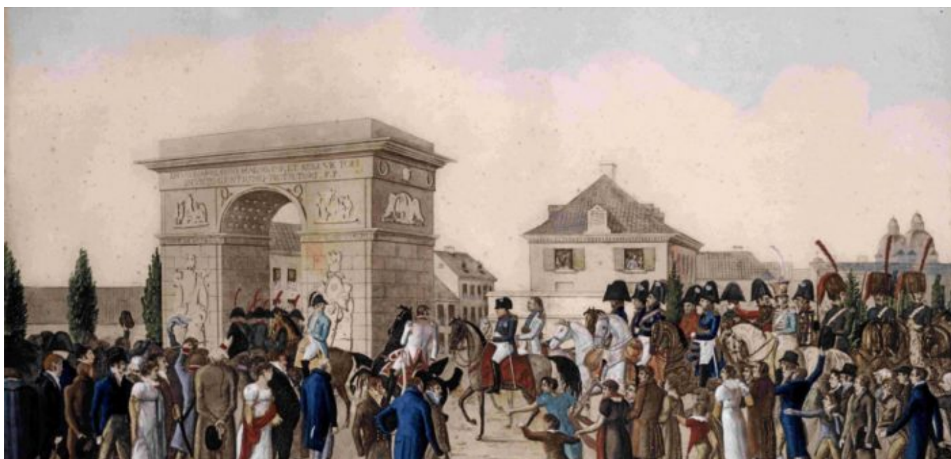
Triumphaler Empfang: Napoleon in Düsseldorf 1811

allerlei Bau- und Verschönerungsmaßnahmen führte, sodass die Bürger*innen den Kaiser 1811 durch mit Wohlwollen empfangen. Es war die flüchtige Begeisterung Napoleons für unser Städtchen, das den Spitznamen „Klein Paris“ begründete. Denn, seien wir ehrlich, die Ähnlichkeiten zwischen der Metropole an der Seine und unserem niedlichen Dorf an der Düssel sind bei näherer Betrachtung eher gering.