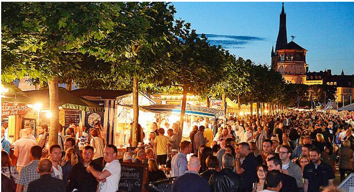
Savoir vivre: In der Altstadt beim Frankreichfest

Genau in dieser Phase zeigte sich aber eine andere Bewegung, in der unser späterer erster Bundeskanzler, der bereits erwähnte Konrad Adenauer, eine nicht unbedeutende Rolle spielte. Ermutigt durch die französische Besatzung und durch politische Kräfte in Frankreich und Belgien unterstützt träumten Separatisten von einer Rheinischen Republik, die losgelöst von den verhassten Preußen als eigenständiger Staat an Frankreich angelehnt existieren sollte. Das fanden die anderen Alliierten nicht witzig, sodass Frankreich und Belgien ihre Unterstützung zurückzogen. Mit eigenen Schutztruppen, die ihren Unterhalt durch Requirieren bei der eher unwilligen Bevölkerung bestritten hatten, versuchten die Separatisten ihre kurzen Sommer der Republik mit militärischer Gewalt zu verlängern, aber im November 1923 war der Traum ausgeträumt. Diese merkwürdige Phase in der Beziehung zwischen Frankreich und dem Rheinland hat allerdings kaum Spuren hinterlassen.