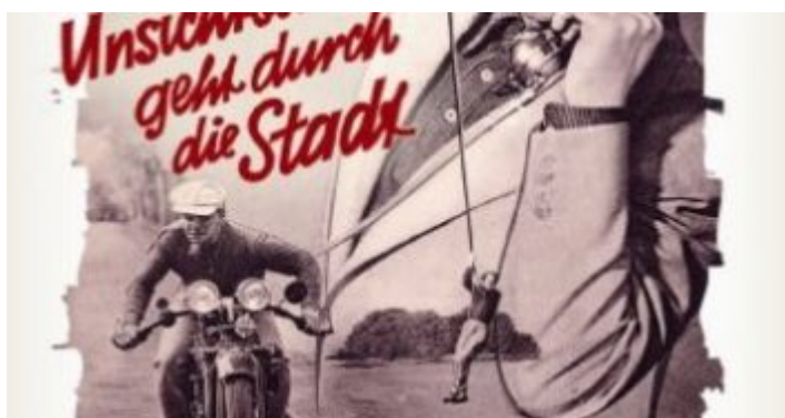
„Ein Unsichtbarer geht durch die Stadt“ von 1933

Berliner Gesellschaft zugerechnet. Nach der Machtergreifung durch die NSDAP im Jahr 1933 wurde Harry Piel – übrigens nicht nur in den deutschsprachigen Ländern, sondern auch im übrigen Europa und sogar in der Sowjetunion – immer populärer. 1939 wurde seine Filmfirma – wie fast alle anderen Gesellschaften dieser Branche – verstaatlicht, und gegen Ende des zweiten Weltkrieges nahm ihn Propagandaminister Goebbels in die sogenannte „Gottbegnadeten-Liste“ auf, und seine Filme wurden massiv zur Truppenunterhaltung eingesetzt. Politisches spielte in Piel's Filmen nie eine explizite Rolle, und seine mögliche politische Haltung spiegelt sich lediglich in seinem erkolonialistischen Umgang mit allem Exotischen wieder.