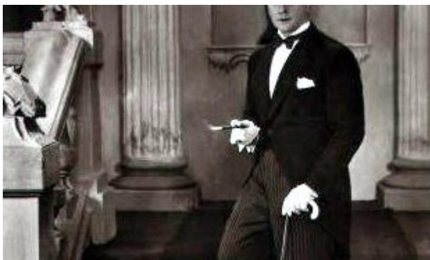
Harry Piel als Dandy auf dem berühmten Foto von Alexander Binder

Wir wissen nicht, ob der Benrather Heinrich August Piel glühender Nazi war, aber dass er bereits vor 1933 Mitglied der NSDAP und Fördermitglied der SS war. Im Rahmen der sogenannten „Entnazifizierung“ saß er nach 1945 ein halbes Jahr im Knast und war mit einem fünfjährigen Berufsverbot belegt. Als er wieder als Produzent, Regisseur und Schauspieler arbeiten durfte, war schon knapp sechzig und durchaus kein gebrochener Mann. Nur, das deutsche Kinopublikum, das hatte ihn wohl vergessen, und so ging seine wiedergegründete Filmfirma „Ariel“ gleich zweimal nacheinander den Bach runter. Piel war pleite und unten durch. 1960 wurde er Witwer und 1961 starb er ziemlich einsam in München. Und doch: Dieser Harry Piel, der alle seine Stunts selbst absolviert hat, muss als Erfinder des Action-Films gefeiert werden.