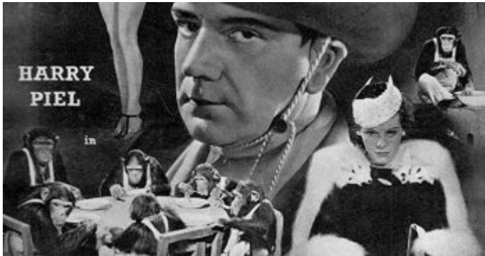
Filmplakat „Menschen, Tiere, Sensationen“

Weil er Produzent, Drehbuchautor und Regisseur in einer Person war, kann man ihn getrost als den ersten Autorenfilmer der Geschichte betrachten. Gleich sein erste Langfilm, ein Streifen namens „Schwarzes Blut“ mit dem großen Curt Goetz in der Hauptrolle, dem späteren König der Filmkomödienschreiber. An die 100 Stummfilme drehte Piel, und weil er mehr Action wollte und keine geeigneten Schauspieler fand, wurde er eben Schauspieler in seinen eigenen Filmen. In den Zwanzigerjahren wurde er berühmt als „Dynamit-Regisseur“, weil in seinen Streifen fast immer etwas in die Luft flog. Überhaupt war er ein fortschrittsgläubiger Mensch, etwa so wie die italienischen Futuristen, die sich für jede technische Entwicklung begeisterten und an eine glückliche Zukunft der Menschheit glaubten. Piel war einer der ersten, der komplett auf Tonfilm umstellten und damit immer erfolgreicher wurde. Seine Gesellschaft hieß nun „Ariel“ und produzierte Abenteuer- und Kriminalfilme am Fließband.