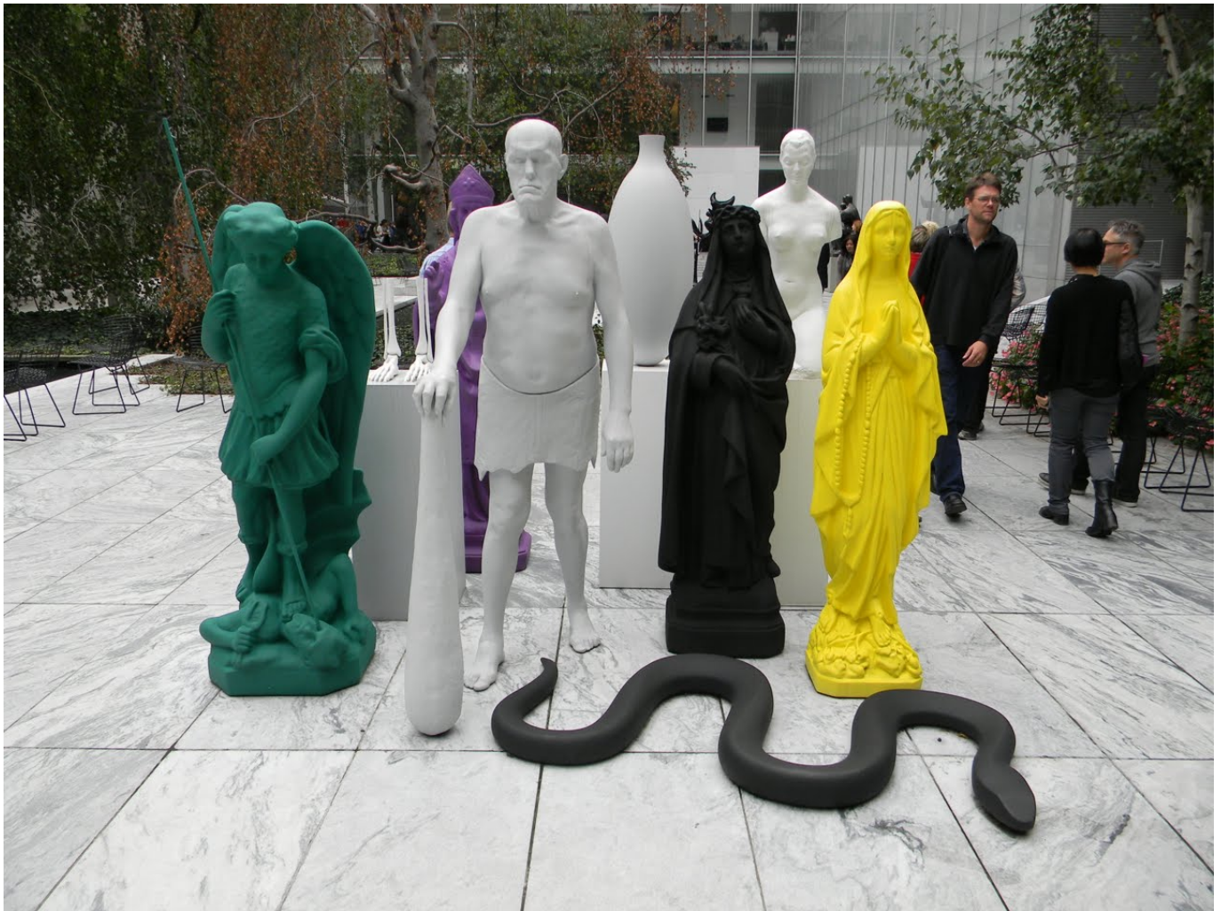
Katharina Fritsch: Figurengruppe mit Schlange

in die Öffentlichkeit zu bringen, braucht es eine enorme mentale Kraft und großes Durchhaltevermögen – man denke nur an den verhüllten Reichstag von Christo und Jeanne-Claude. In den öffentlichen Raum ging sie bereits 1987 mit einer neonfarbenen Lourdes-Madonna in der Münsteraner Innenstadt.