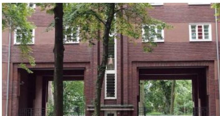
Der Eulerhof in Flingern – auf einem Grundstück, das einst Joseph Euler gehörte