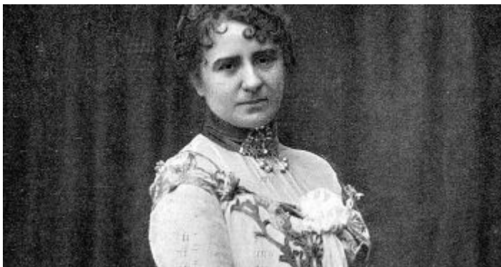
Louise Dumont um die Jahrhundertwende