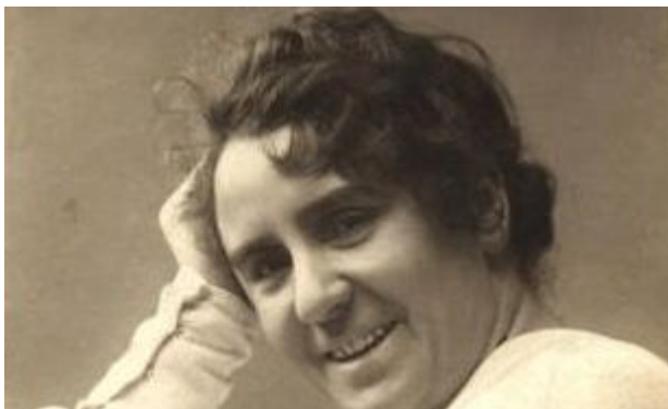
Louise Dumont im Jahr 1902