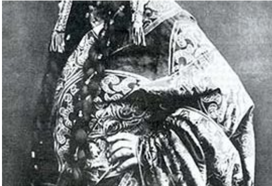
Louise Dumont im Kostüm ca. 1910

Es gibt nicht viele Beschreibungen ihrer Persönlichkeit von Zeitzeugen, aber wir dürfen sie uns als kleine, kompakte Frau mit großem Temperament vorstellen. Als starke, engagierte Frau, die für die Zeit der Jahrhundertwende geradezu außergewöhnlich politisch dachte und auch handelte – u.a. dadurch, dass sie eine Hilfsorganisation für Schauspielerinnen gründete, die damals drastisch unterbezahlt waren und sich meist ihre Kostüme selbst kaufen oder schneidern lassen mussten. Sie war, das belegen auch ihre Briefe, eine emanzipierte Frau, sicher nicht weniger als beispielsweise Bertha von Suttner. Und weil sie das war, gibt es immer wieder Gerüchte, sie sei in Wahrheit lesbisch oder zumindest bisexuell gewesen. Pazifistin, das lehrt ihre Bekanntschaft mit Herbert Eulenberg, war sie sicher. Dass sich ihr Partner für den Einsatz im ersten Weltkrieg freiwillig meldete, kann ihr nicht gefallen haben.