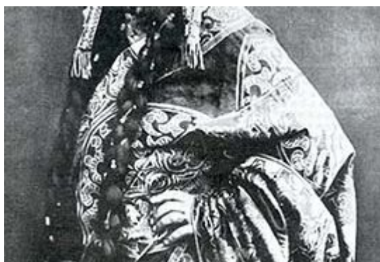
Louise Dumont im Kostüm ca. 1910

Es gibt nicht viele Beschreibungen ihrer Persönlichkeit von Zeitzeugen, aber wir dürfen sie uns als kleine, kompakte Frau mit großem Temperament vorstellen. Als starke, engagierte Frau, die für die Zeit der Jahrhundertwende geradezu außergewöhnlich politisch dachte und auch handelte – u.a. dadurch, dass sie eine Hilfsorganisation für Schauspielerinnen gründete, die damals drastisch unterbezahlt waren und sich meist ihre Kostüme selbst kaufen oder schneidern lassen mussten. Sie war, das belegen auch ihre Briefe, eine emanzipierte Frau, sicher nicht weniger als beispielsweise Bertha von Suttner. Und weil sie das war, gibt es immer wieder Gerüchte, sie sei in Wahrheit lesbisch oder zumindest bisexuell gewesen. Pazifistin, das lehrt ihre Bekanntschaft mit Herbert Eulenberg, war sie sicher. Dass sich ihr Partner für den Einsatz im ersten Weltkrieg freiwillig meldete, kann ihr nicht gefallen haben.