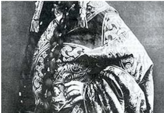
Louise Dumont im Kostüm ca. 1910

Es gibt nicht viele Beschreibungen ihrer Persönlichkeit von Zeitzeugen, aber wir dürfen sie uns als kleine, kompakte Frau mit großem Temperament vorstellen. Als starke, engagierte Frau, die für die Zeit der Jahrhundertwende geradezu außergewöhnlich politisch dachte und auch handelte – u.a. dadurch, dass sie eine Hilfsorganisation für Schauspielerinnen gründete, die damals drastisch unterbezahlt waren und sich meist ihre Kostüme selbst kaufen oder schneidern lassen mussten. Sie war, das belegen auch ihre Briefe, eine emanzipierte Frau, sicher nicht weniger als beispielsweise Bertha von Suttner. Und weil sie das war, gibt es immer wieder Gerüchte, sie sei in Wahrheit lesbisch oder zumindest bisexuell gewesen. Pazifistin, das lehrt ihre Bekanntschaft mit Herbert Eulenberg, war sie sicher. Dass sich ihr Partner für den Einsatz im ersten Weltkrieg freiwillig meldete, kann ihr nicht gefallen haben.