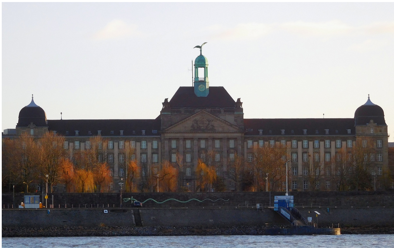
Die Bezirksregierung genehmigt den städtischen Haushalt

Verluste (im Fall Düsseldorfs sind es 107,4 Millionen Euro) rausnehmen – irgendwelche Mittel fließen dabei nicht.