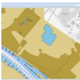
Stromkilometer 707 bei Wittlaer

Der Leser „Hajo“ war natürlich auf der richtigen Spur und hat sich nur minimal vertan. Tatsächlich wurden im Januar 1975 Baumberg und Monheim von Düsseldorf eingemeindet; Hitdorf wurde dabei abgetrennt. Kaum anderthalb Jahre später wurden die Orte aber wieder ausgemeindet – dazu demnächst mehr hier in einem lokalhistorischen Beitrag. Also lag im Sommer 1975 der südlichste Stromkilometer auf Höhe der Grenze zwischen Monheim und Hitdorf. Die wiederum liegt ziemlich exakt an der südlichen Kante des Reiterguts Blee (siehe Titelfoto). Und dort befindet sich der Stromkilometer 707.