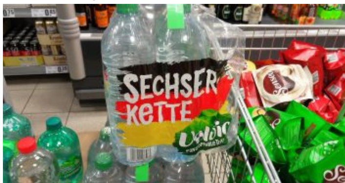
Eine der blödesten EM-Ideen

Interessant dass keine einzige befragte Person mit ihrem Namen erscheinen wollte und dass die befragten Getränkemärkte und Tankstellen darauf bestanden, ebenfalls nicht namentlich genannt zu werden. Um die befragten Angestellten zu schützen, verschweigen wir auch die Namen der Geschäfte und Kaufhäuser. In einem der großen Warenhäuser dieser Stadt fanden sich Fanartikel ab Ende Mai gleich in mehreren Abteilungen – vor allem Trikots, Hüte, Mützen, Blumenketten und Schals. Am Ende der ersten EM-Woche hatte man den Kram dann im Erdgeschoss zusammengezogen. Eine Verkäuferin: „Hier am Sonderstand verkaufen wir praktisch nichts. Oben in der Sportabteilung sind wohl die aktuellen deutschen Trikots ganz