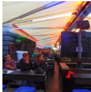
Business as usual an den Kasematten