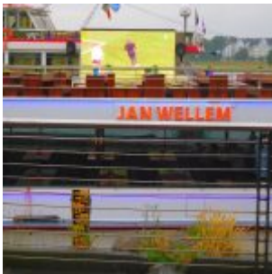
Tote Hose auf der Jan Wellem