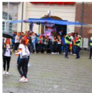
Keine Party auf der „Fanmeile“