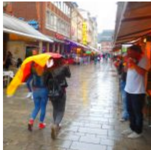
Auf der Bolkerstraße bei der EM 2016: Die Flagge als Regenschutz