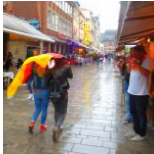
Auf der Bolkerstraße bei der EM 2016: Die Flagge als Regenschutz