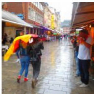
Auf der Bolkerstraße bei der EM 2016: Die Flagge als Regenschutz