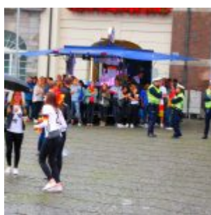
Keine Party auf der „Fanmeile“