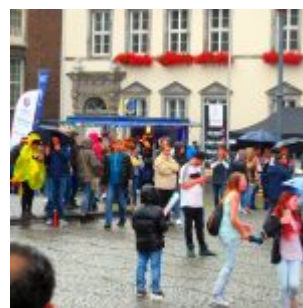
Mehr war nicht auf der „Fanmeile“