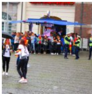
Keine Party auf der „Fanmeile“