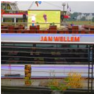
Tote Hose auf der Jan Wellem