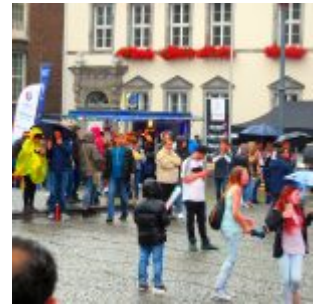
Mehr war nicht auf der „Fanmeile“