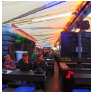
Business as usual an den Kasematten