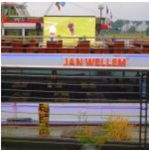
Tote Hose auf der Jan Wellem