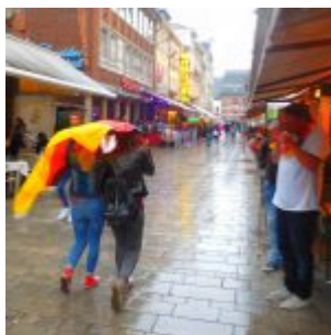
Auf der Bolkerstraße bei der EM 2016: Die Flagge als Regenschutz