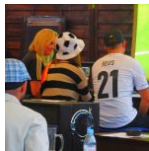
Drei Fans an den Kasematten