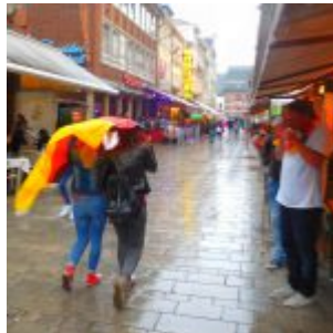
Auf der Bolkerstraße bei der EM 2016: Die Flagge als Regenschutz