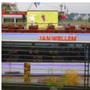
Tote Hose auf der Jan Wellem