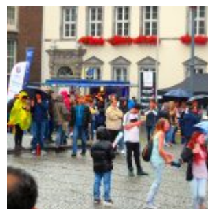
Mehr war nicht auf der „Fanmeile“