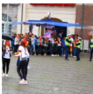
Keine Party auf der „Fanmeile“