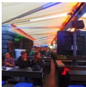
Business as usual an den Kasematten