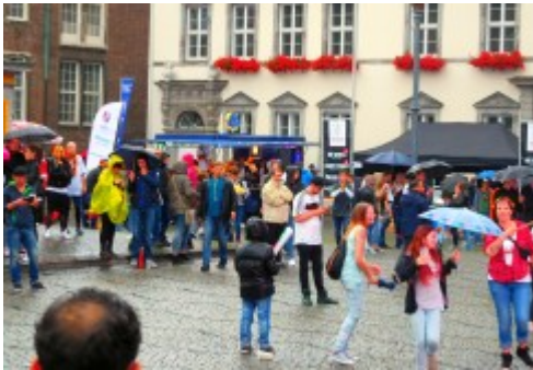
Mehr war nicht auf der „Fanmeile“