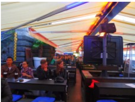
Business as usual an den Kasematten