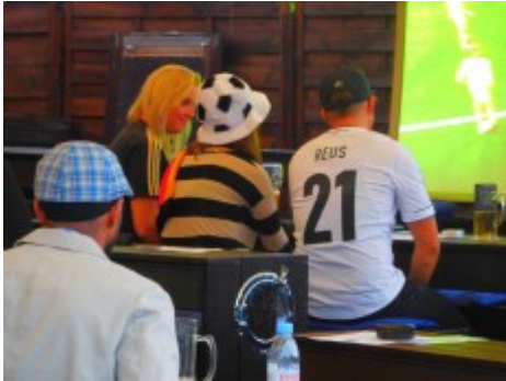
Drei Fans an den Kasematten