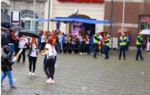
Keine Party auf der „Fanmeile“