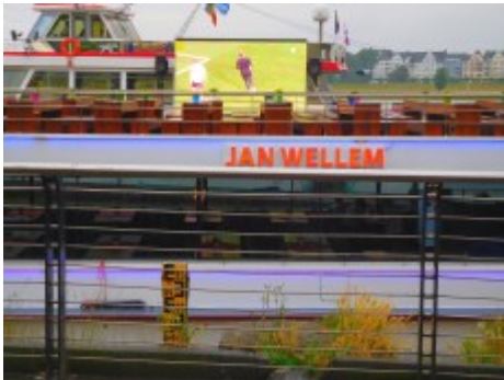
Tote Hose auf der Jan Wellem