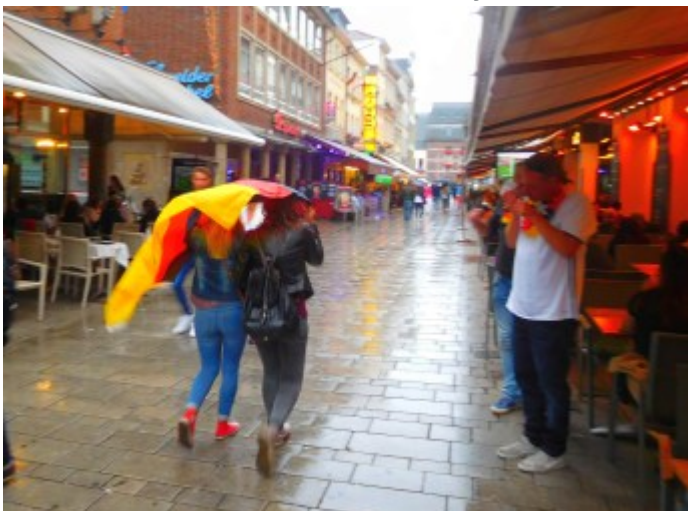
Auf der Bolkerstraße bei der EM 2016: Die Flagge als Regenschutz

Der Kellner von einem beliebten Lokal auf der Andreasstraße, der weder seinen, noch den