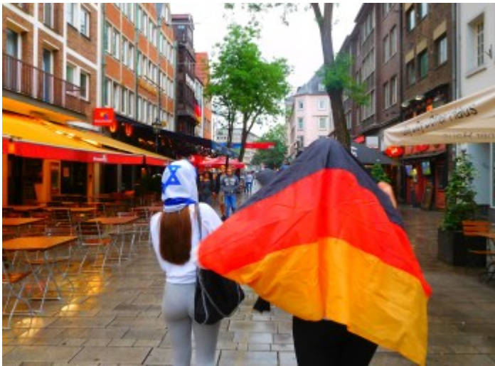
Auf der Suche nach der Fan-Party