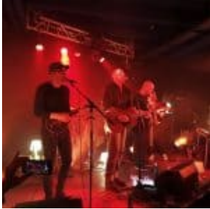
Eindrücke vom CD-Release- Konzert im ZAKK am 17.5.2019