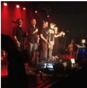
Eindrücke vom CD-Release- Konzert im ZAKK am 17.5.2019

Warum One Eye Open eine meiner absoluten Lieblingsbands in und aus Düsseldorf ist? Klar, Mann, weil da vier bis fünf Menschen Musik machen, die Musik so lieben, das man es jederzeit hören kann. Natürlich besonders bei Live-Auftritten wie dem CD-Release-Konzert am 17. Mai im ZAKK. Nein, es nicht die besondere Ausstrahlung des Frontmanns, der feine Charme der Dame an der Violine, die unermüdliche Bearbeitung von Mandoline und Banjo durch den Herrn ganz links, der sichtbaren Spaß des Kerls an den Perkussiondingern oder das feine Posaunenspiel des schüchternen Typen, der ab und an auf die Bühne geholt wird – es ist das Gesamtkunstwerk.