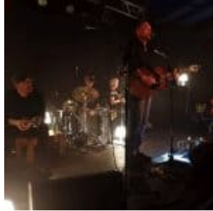
Eindrücke vom CD-Release- Konzert im ZAKK am 17.5.2019