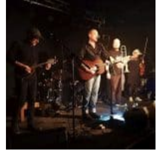
Eindrücke vom CD-Release- Konzert im ZAKK am 17.5.2019