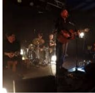
Eindrücke vom CD-Release- Konzert im ZAKK am 17.5.2019