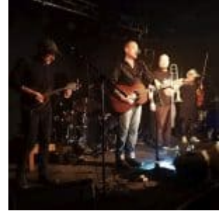
Eindrücke vom CD-Release- Konzert im ZAKK am 17.5.2019